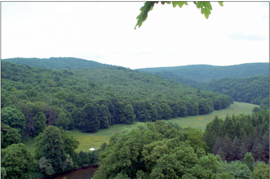
Abb. 4: Blick vom Umlaufberg auf die große Umlaufwiese (Zone 4), dem Treffpunkt an diesem Tag. – Fig. 4: View to the meadow near the “Umlaufberg”-hill (zone 4), the meeting point of the day.