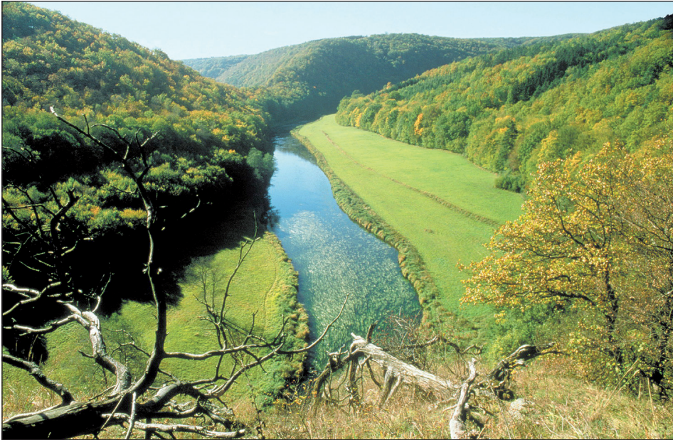
Abb. 1: Blick vom Rabenfelsen auf die Thaya und den Umlaufberg. – Fig. 1: View over the Thaya valley and hills.