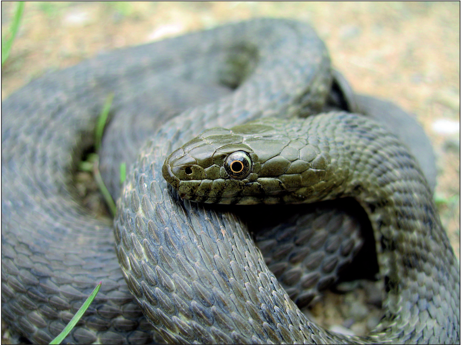
Abb. 12: Würfelnatter ( Natrix tessellata ) (Bildrechte: J. HILL). – Fig. 12: Dice snake ( Natrix tessellata ) (Copyright: J. HILL).