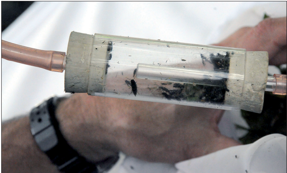
Abb. 7: Diverse Insekten in einem Exhauster. – Fig. 7: Insects in an exhauster.