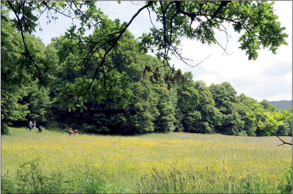
Abb. 3: Große Umlaufwiese (Zone 4). – Fig. 5: Large meadow (zone 4).