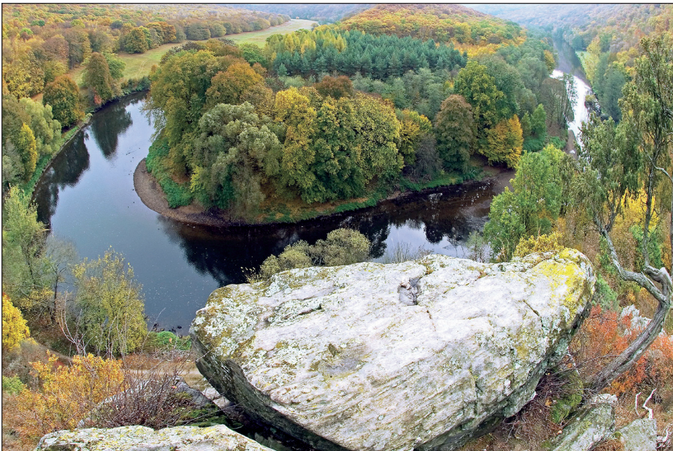
Abb. 2: Blick vom Österreichischen Umlaufberg auf den Tschechischen Umlaufberg. – Fig. 2: View from the famous Austrian peak in the National Park to the Czech peak.