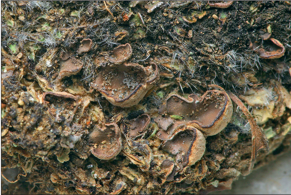
Abb. 6: Peltigera lepidophora. – Fig. 6: Peltigera lepidophora.