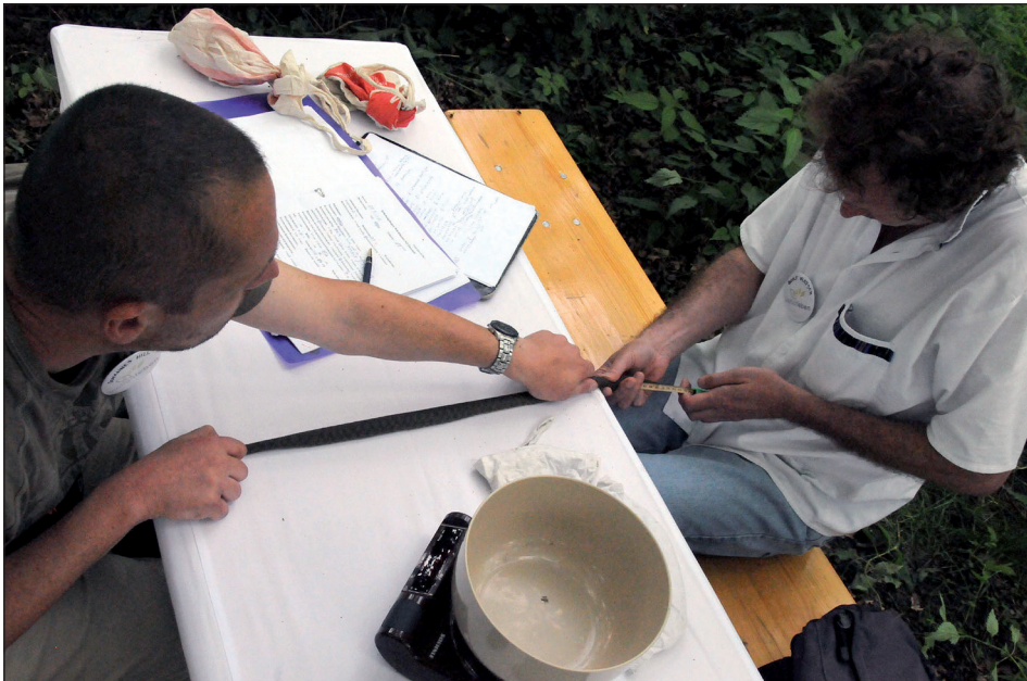
Abb. 11: Die gefangenen Schlangen wurden gemessen und gewogen. – Fig. 11: The body length and weight of the snakes were measured.

3 Schlangen- und 2 Echsenarten wurden am TAV bestätigt (Tab. 15). Beeindruckend war die hohe Abundanz der Nattern im Gebiet: Mindestens 12 Würfelnatterindividuen wurden gezählt (Abb. 11, Abb. 12).