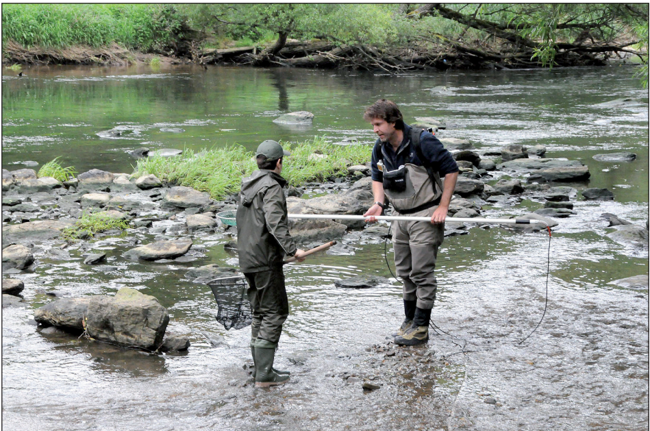
Abb. 10: Fachmännisches Elektrofischen in der Thaya. – Fig. 10: Expert electrofishing in the Thaya river.