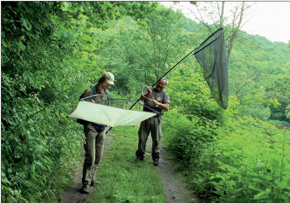
Abb. 8: Sammelmethode der Coleopterologen. – Fig. 8: Sampling methods of coleopterists.