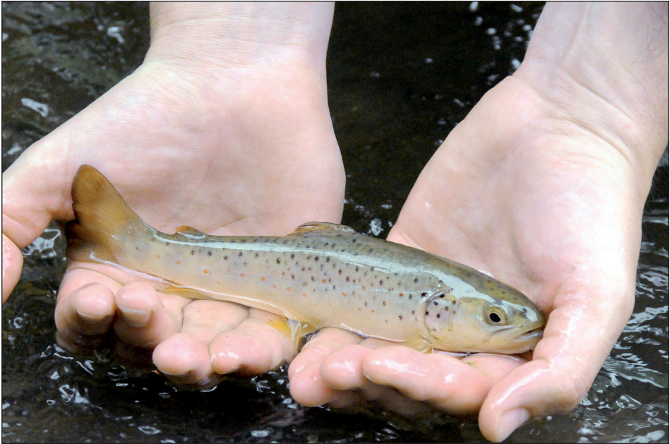
Abb. 9: Bachforelle ( Salmo trutta ) in der Thaya. – Fig. 9: Brown trout ( Salmo trutta ) in the Thaya river.