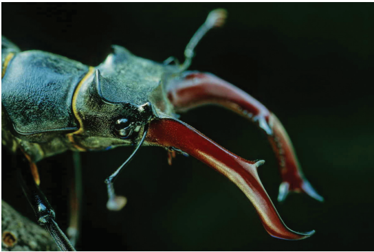
Das Männchen des Hirschkäfers ( Lucanus cervus ) mit den überdimensionierten Mandibeln ist der größte Käfer Europas (Foto: P. Zábranský).

Der Hirschkäfer ist ein gutes Beispiel einer einst häufigen Käferart, die eher anspruchslos ist und dennoch in weiten Teilen Mitteleuropas deutliche Rückgänge hinnehmen musste. Dank der unterirdischen Entwicklung der Larve in abgestorbenen Baumwurzeln ist Lucanus cervus bei weitem nicht so stark gefährdet wie zahlreiche andere xylobionte Käferarten, die etwa auf oberirdisches Totholz großer Dimensionen angewiesen sind. Auch der Hirschkäfer braucht