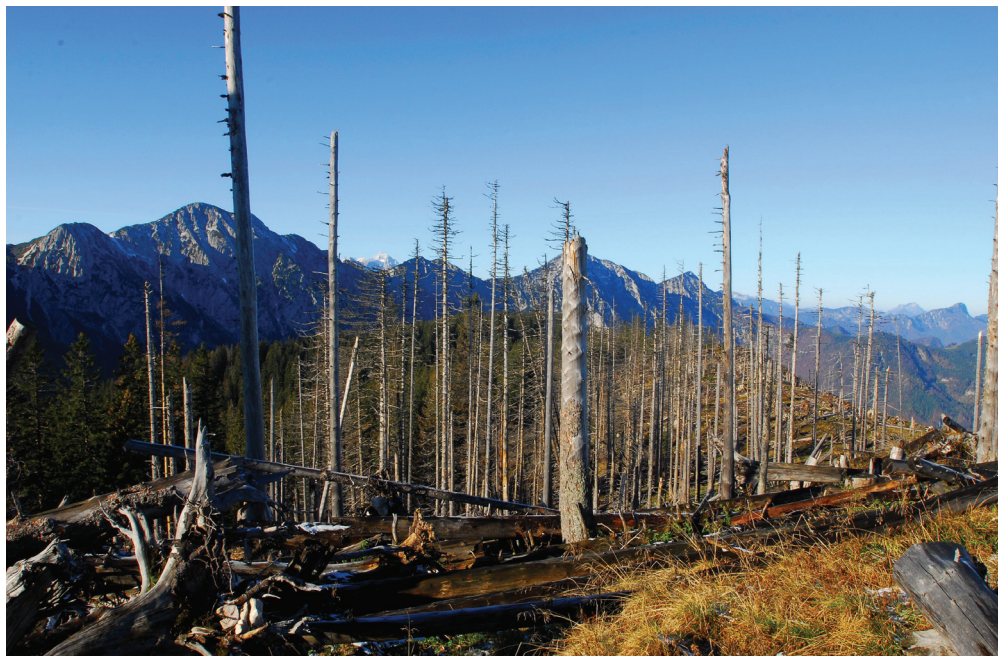
Abb. 1: Sonntagsmauer mit Sengengebirge im Nationalpark Kalkalpen.

auf (frühester Nachweis am 19. Juni), der saisonale Schwerpunkt reicht von Ende Juni bis Mitte August, der bislang späteste Nachweis ist datiert mit dem 15. September. Der Schwerpunkt der Höhenverbreitung liegt in den Tallagen bei 400 m und geht bis auf rund 700 m, über 1000 m Seehöhe gibt es nur noch wenige Beobachtungen, die höchste bei 1200 m. Die Nachweise in der Umgebung des Nationalparks beziehen sich fast ausschließlich auf gelagertes Buchenholz, insbesondere Buchenklafter. Nur hier konnten mehrmalig fünf bis zehn Individuen gleichzeitig angetroffen werden, während im Nationalpark Gebiet immer nur Einzelbeobachtungen vorliegen. Spärliche Nachweise xylobionter Käfer sind in Zusammenhang mit einem hohen Totholzangebot zu interpretieren, weil sich die Tiere dann breit verteilen (KAHLEN 1997). Die Entomologen Christian Mairhuber und Thomas Frieß, die heuer erstmals in quantitativer Form Ausbohrlöcher des Alpenbocks kartierten, vermuten für diese Art einen Besiedlungsschwerpunkt. Es sind dies die mit Laubwald bis nach oben geschlossenen Bergrücken, die demgemäß kaum fragmentiert sind.