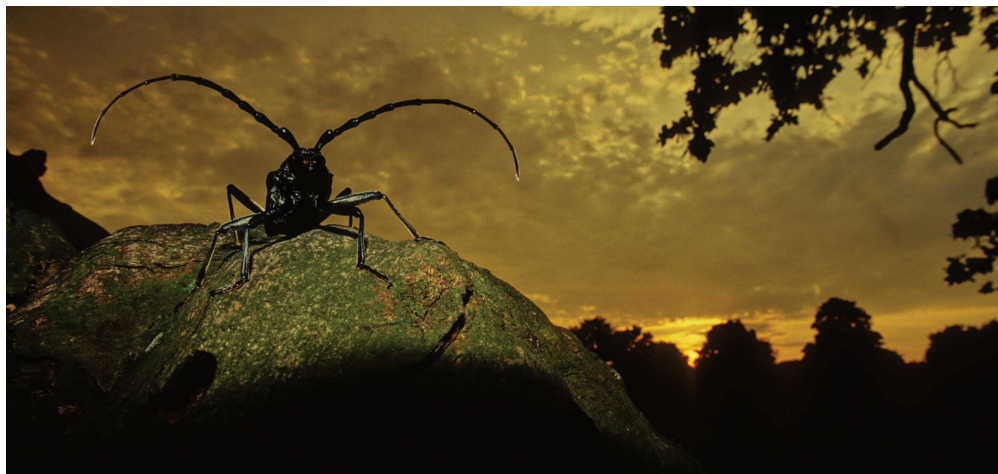
Der Heldbock ( Cerambyx cerdo ) wird erst gegen Abend aktiv.