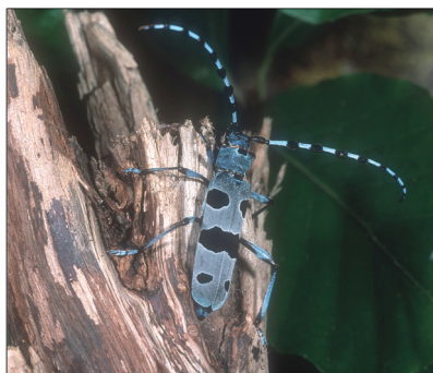
Alpenbock, Rosalia alpina .