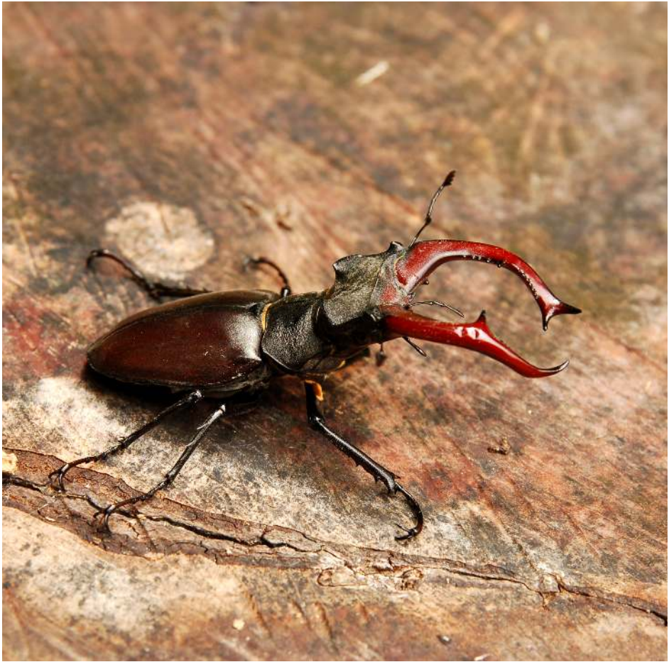
Abb. 1 Hirschkäfer-Männchen.

Das gegenwärtige Vorkommen des Hirschkäfers scheint sich auf zwei Gebiete zu konzentrieren: einerseits den Raum Dubrauke-Kleinsaubernitz, andererseits die Umgebung von Weißwasser (Karte 1).