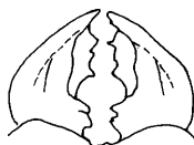
Platycerus caprea Deg.