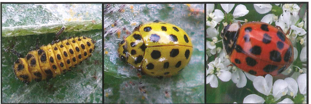
Abb. 4–5: Der Gemeine Pilz-Marienkäfer, auch Zweiundzwanzigpunkt-Marienkäfer genannt ( Pysyllobora vigintiduopunctata ), auf Astragalus glycyphyllos mit Erysiphe astragali ; Abb. 4 (links): Larve; Abb. 5 (Mitte): Imago (Größe ca. 4 mm); Abb. 6 (rechts): Der Asiatische Marienkäfer ( Harmonia axyridis ), Größe ca. 7 mm, auf Blüten von Chaerophyllum aureum .