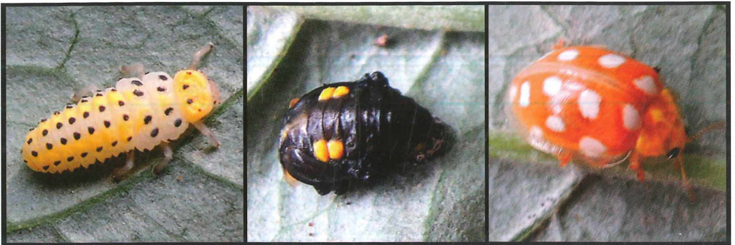
Abb. 1–3: Der Sechzehnleckige Pilz-Marienkäfer ( Halyzia sedecimguttata ) auf Sambucus racemosa mit Erysiphe vanbruntiana . Abb. 1 (links): Larve; Abb. 2 (Mitte): Puppe; Abb. 3 (rechts): Imago (Größe ca. 6 mm).

mit Befall von Mehltäupilzen beobachten, so an Frangula alnus mit Erysiphe divaricata bei Treuen (5439/44) am 05.09.2009, an Sambucus racemosa mit Erysiphe vanbruntiana bei Treuen (5439/44) am 05.09.2009 (DIETRICH 2013) und auf dem Pöhlberg (5444/13) am 30.09.2011, an Quercus robur mit Erysiphe alphitoides in Annaberg-Buchholz (5444/11) am 05.08.2010, sowie an Filipendula ulmaria mit Podospaera spiraeae in Annaberg-Buchholz (5444/11) am 17.07.2011. Ob die Imagines diese Mehltäupilze als Nahrung aufnahmen, konnte ich nicht feststellen. Da viele Marienkäferarten neben Blattläusen auch andere Nahrung, wie z.B. Pollen nutzen, wäre es nicht auszuschließen, dass Harmonia axyridis gelegentlich auch Echte Mehltäupilze frisst.