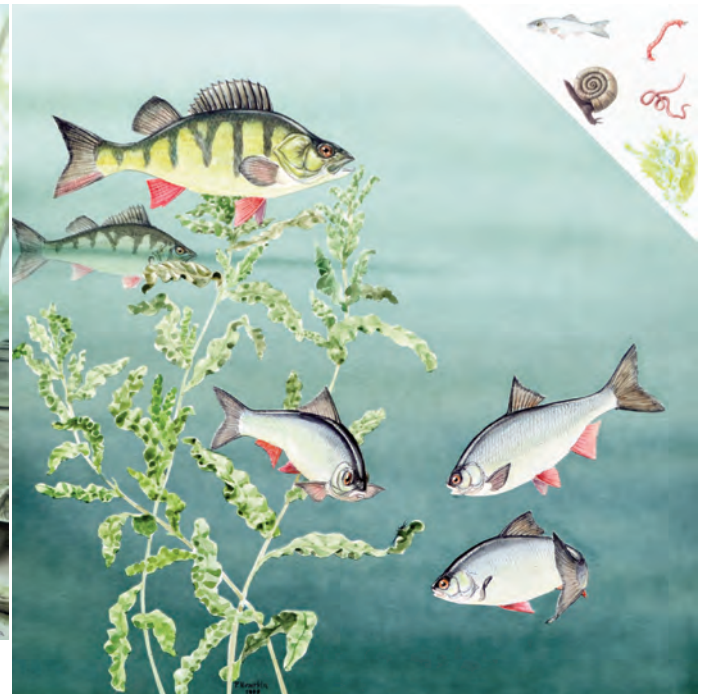
Abb. 14: Flussbarsch ( Perca fluviatilis ) und Rotaugen ( Rutilus rutilus ). Beide Fischarten sind Uferbewohner, wobei sich Rotaugen von Algen, Zuckmückenlarven, Schnecken und Röhrenwürmern ernähren, Barsche daneben aber als Räuber Jungfische bevorzugen.