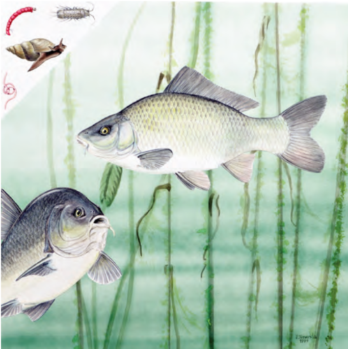
Abb. 17: Karpfen ( Cyprinus carpio ). Der aus Asien stammende Karpfen ist sowohl wirtschaftlich als auch für die Sportfischerei von Bedeutung. Er ist ein typischer Bodenwühler, der seine Nahrung aus dem Schlamm filtert. Er lebt vor allem von Schnecken, Röhrenwürmern, Wasserasseln und Zuckmückenlarven.