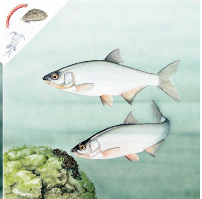
Abb. 12: Rußnase ( Vimba vimba ). Die Rußnase fällt besonders in der Laichzeit auf, wo sie in großer Zahl und in einer auffälligen Brutfarbe zum Ablachen in die Zuflüsse der Seen wandert. Ihre Nahrung besteht aus Copepoden, Zuckmückenlarven und der Wandermuschel Dreissena polymorpha .