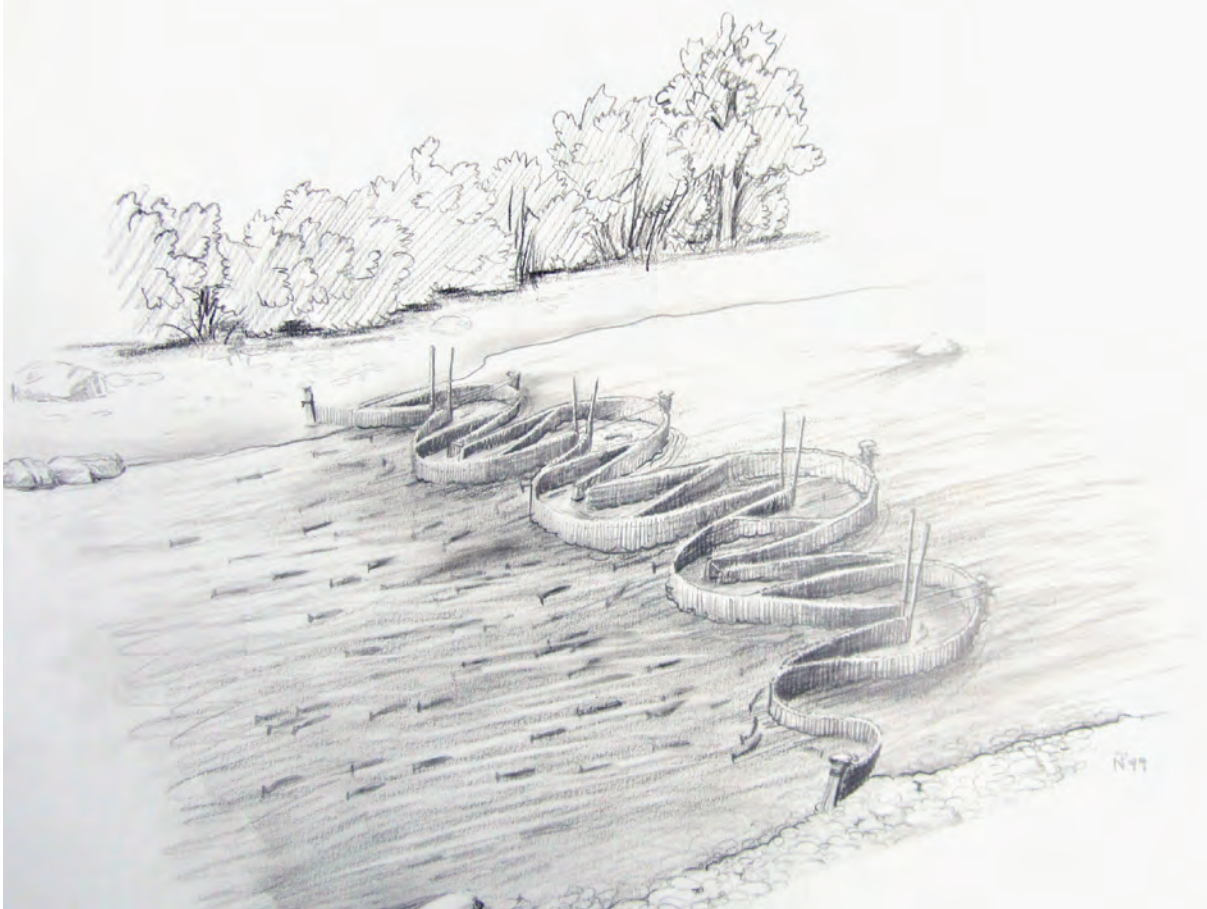
Abb. 7: Flussreuse.