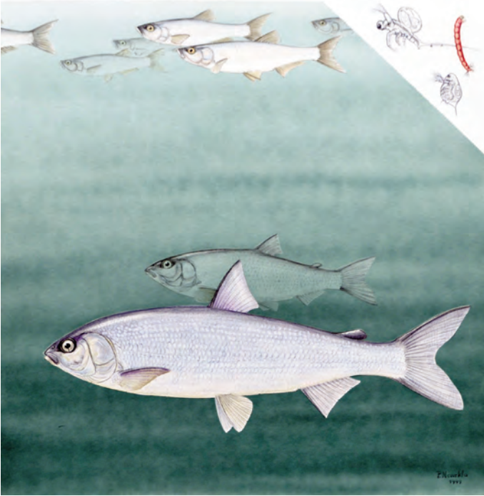
Abb. 11: Seelaube ( Chalcalburnus chalcoides mento ) und Reinanke ( Coregonus lavaretus ). Beide Fischarten leben im Freiwasser, die Seelaube im Oberflächenbereich, die Reinanke eher im Tiefenbereich. Letztere ist für die Fischereiwirtschaft von Bedeutung. Ihre Nahrung besteht im Wesentlichen aus Zooplankton, wie z.B. Leptodora , Daphnien und Chironomiden-Larven.