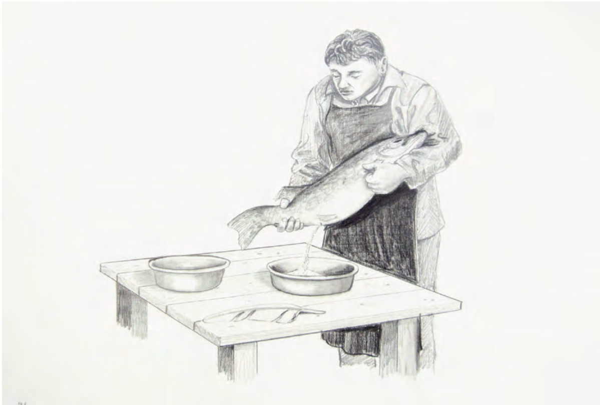
Abb. 8: Laich- gewinnung.