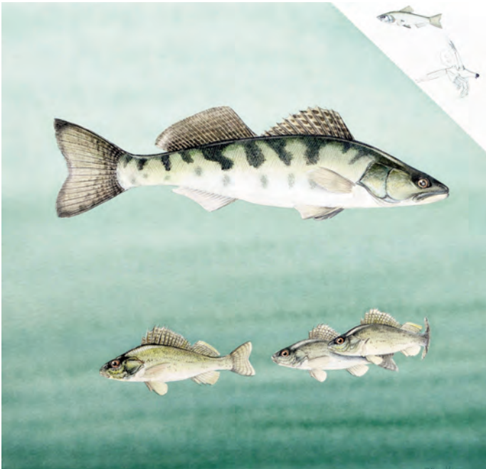
Abb. 15: Zander ( Stizostedion lucioperca ) und Kaulbarsch ( Gymnocephalus cernua ). Der Zander ist vor allem für die Sportfischerei von Bedeutung. In der juvenilen Phase ernährt er sich von Zooplankton, wie z.B. Bythotrephes , später sind aber andere Fische die Hauptnahrung. Der Kaulbarsch frisst ebenfalls Zooplankton und andere Kleintiere wie Insektenlarven.