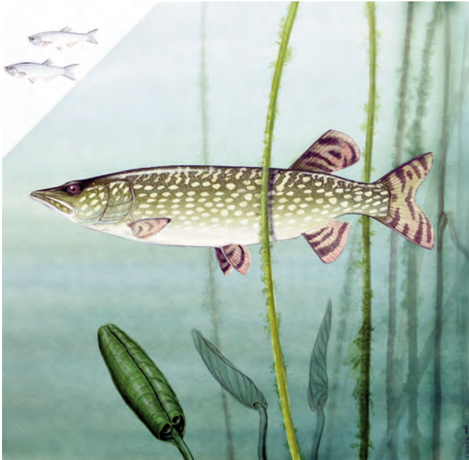
Abb. 19: Hecht ( Esox lucius ). Der typische Räuber vermag bereits als Jungfisch gleich große Beute zu verschlingen, wobei er auch vor Artgenossen nicht halt macht. Er ist wirtschaftlich und als Sportfisch von Bedeutung.