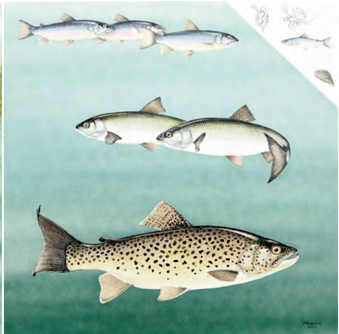
Abb. 18: Seesaibling ( Salvelinus alpinus ), Perlflussbarsch ( Rutilus frisii meidingeri ) und Seeforelle ( Salmo trutta ). Alle drei Arten sind auf sehr gute Wasserqualität angewiesen und alle haben ein ähnliches Nahrungsspektrum. In der Jugend ist es Zooplankton, beim Perlflussbarsch sind es auch Muscheln und Pflanzen. Saibling und Seeforelle werden im Alter räuberisch. Der Perlflussbarsch weist in der Laichzeit einen charakteristischen Laichauschlag auf, der ihm den Namen gegeben hat.