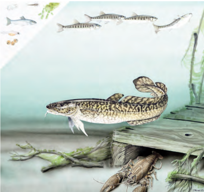
Abb. 13: Elritze ( Phoxinus phoxinus ), Aalrutte ( Lotta lotta ) und Flusskreb ( Astacus astacus ). Elritzen sind in der Nähe des Ufers zu finden, ihre Nahrung setzt sich aus Algen und diversen Kleintieren, wie Muschelkrebchen und Insektenlarven zusammen. Die Aalrutte oder Quappe ist eher räuberisch und nährt sich von Fischlaich und Jungfischen. Sie ist der einzige dorschartige Fisch des Süßwassers. Der Flusskreb ist durch die Krebspest ( Aphanomyces astaci ) in Österreichs Gewässern stark bedroht. Es kommt zur Reinfektion und zudem zur Konkurrenz mit dem Signalkreb ( Pacifastacus leniusculus ). Als Opportunist lebt der Flusskreb von diversen Kleintieren und vor allem auch als Aasfresser.