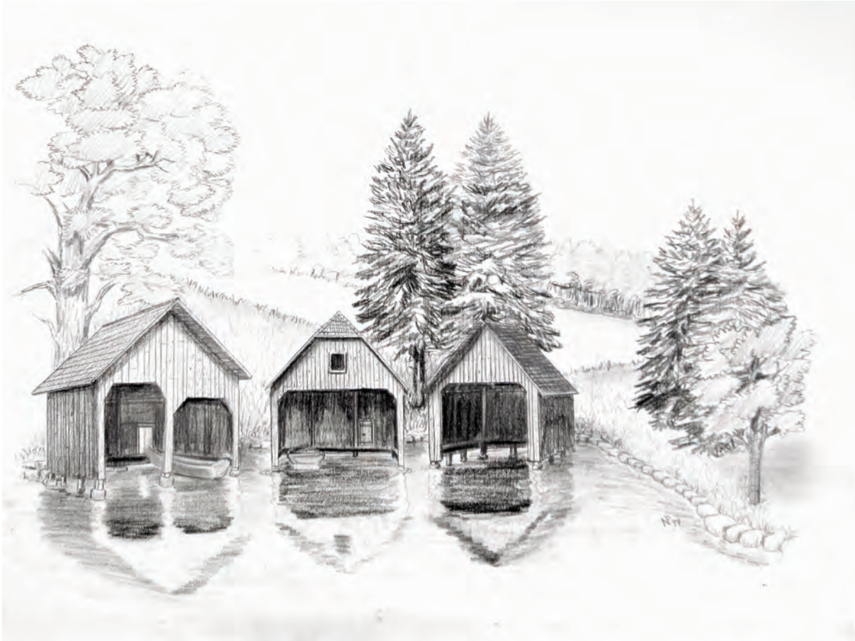
Abb. 3: Bootshütten.