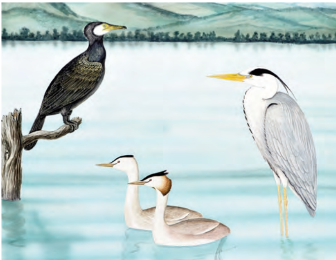
Abb. 21: Kormoran ( Phalacrocorax carbo ), Haubentaucher ( Podiceps cristatus ) und Fischreiher ( Ardea cinera ). Kormorane ( Phalacrocorax carbo ) kommen sowohl an stehenden als auch an fließenden Gewässern vor. Sie nisten und brüten in großen Kolonien im Frühjahr in den Baumbeständen entlang von Gewässern. Kormorane sind seit der Einführung von Jagdverboten in den letzten Jahren zur Plage geworden. Ihre Anzahl ist drastisch gestiegen und der wirtschaftliche Schaden ist enorm groß; wenn sie über ein Fischgewässer herfallen, bedeutet dies für Teichwirte oft den Totalausfall ihrer Zuchten. Haubentaucher ( Podiceps cristatus ) bevorzugen stehende Gewässer, wo sie im Schilfgürteln brüten. Ihre Jungen tragen sie am Beginn in den warmen Rückendaunen. Auch ihre Nahrung ist ausschließlich Fisch. Fischreiher ( Ardea cinera ) sind typische Lauer-Beutegreifer, die ruhig im Wasser stehend den Fischen auflauern. Sie brüten meist in Kolonien im zeitigen Frühjahr. Neben den zur Nahrung aufgenommenen Fischen werden leider auch sehr viele Fische verletzt, die vom Reiher aufgespießt doch noch entkommen.