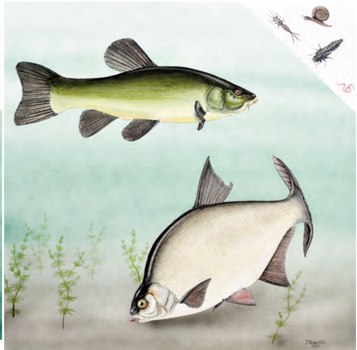
Abb. 16: Schleie ( Tinca tinca ) und Brachse ( Abramis brama ). Beide Fischarten suchen ihre Nahrung hauptsächlich am Boden und im Bereich der Wasserpflanzen, wobei sie Schnecken, Röhrenwürmer, Libellen- und andere Insektenlarven fressen. Beliebte sind beide Arten bei den Sportfischern.