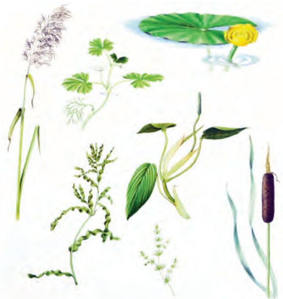
Abb. 22: Schilf ( Phragmites australis ), Rohrkolben ( Typha latifolia ), Gelbe Teichrose ( Nuphar lutea ), Wasser-Hahnenfuß ( Ranunculus aquatilis ), Schwimmendes Laichkraut ( Potamogeton natans ), Krauses Laichkraut ( Potamogeton crispus ) und Armeleuchteralge ( Chara sp.). Schilf ( Phragmites australis ) und Rohrkolben ( Typha latifolia ) sind Pflanzen des unmittelbaren Ufers. Die Gelbe Teichrose ( Nuphar lutea ) wagt sich weiter vom Ufer weg und wird begleitet von submersen Wasserpflanzen, wie dem Wasserhahnenfuß ( Ranunculus aquatilis ), dem Schwimmenden Laichkraut ( Potamogeton natans ) und dem Krausen Laichkraut ( Potamogeton crispus ). Noch tiefer im Gewässer kommt die Armeleuchteralge ( Chara sp.) vor.