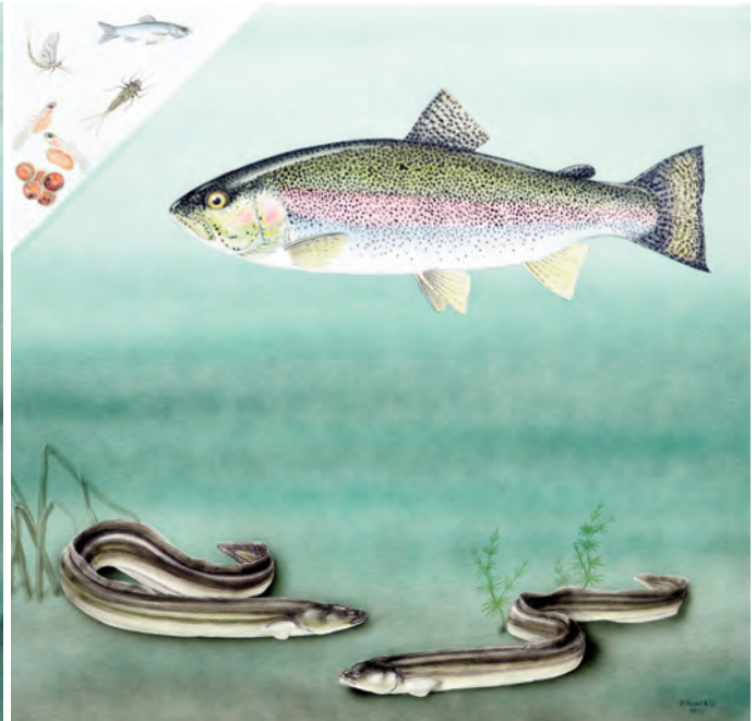
Abb. 20: Regenbogenforelle ( Oncorhynchus mykiss ) und Aal ( Anquilla anquilla ). Die aus Nordamerika stammende Regenbogenforelle ist vor allem in der Teichwirtschaft und für die Sportfischerei von Bedeutung. Ihre Nahrung setzt sich aus Insektenlarven, Anfluginsekten und später auch aus Fischen zusammen. Der Aal ist vor allem durch Besatzmaßnahmen in Österreichs Gewässern verbreitet, kommt aber auch natürlich vor. Als Bodenfisch lebt er hauptsächlich von wirbellosen Tieren, geht aber auch gerne an Fischlaich und Brut.