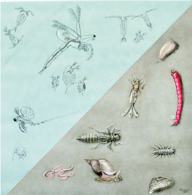
Abb. 23: Pelagisches Plankton sowie Boden- und Schlammbewohner. Unter dem pelagischen, freischwimmenden Plankton finden wir Hüpferlinge, wie Copepoden und Cyclops, große Krebschen wie Leptodora und Bythotrephes , sowie Wasserflöhe, z.B. Daphnien und Rüsselkrebchen. Bei den Boden- und Schlammbewohnern sind Röhrenwürmer, Asseln, Muschelkrebse und Zuckmückenlarven wichtige Futtertiere. Zur Nahrung zählen weiters neben Muscheln (Wandermuschel) und Schnecken (Schlammschnecke) auch Insektenlarven von Eintagsfliegen und Libellen.