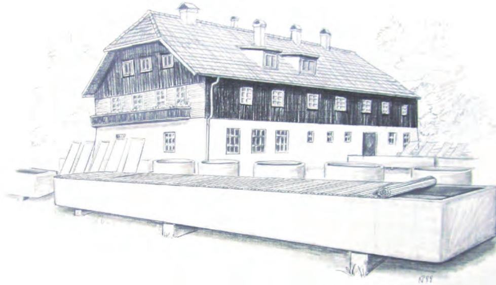
Abb. 9: Fischzucht in Scharfling.

Abb. 10: Diverse Fischfanggeräte. Von Berufsfischern werden vor allem Kiemennetze verwendet, in denen sich die Fische verhängen und Reusen, aus denen die Fische nicht mehr heraus finden können. Schleppnetze sind bei uns weniger gebräuchlich. Mit der Angel wird in der Sportfischerei z.B. mit der Hegene, das sind Imitate von Insektenlarven, vor allem auf Saiblinge und Reinanken gefischt. Für Friedfische wie Karpfen oder Schleien verwendet man Schwimmer und Köder wie Regenwurm oder Mais. Auf Raubfische wird mit dem Blinker „gesponnen“ oder ein toter Köderfisch ausgelegt.