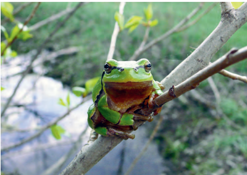
Abb. 10: Laubfrosch ( Hyla arborea ), Männchen, Nähe Marchegg, 10. April 2007.

Dauer nur ein Überleben in den großen zusammenhängenden Schutzgebieten Österreichs möglich sein.