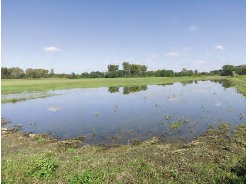
Abb. 1: Leithaluss in der Leithaniederung bei Zurndorf, Burgenland, 28. September 2014.