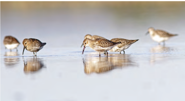
Abb. 13: Alpenstrandläufer ( Calidris alpina ) auf dem Durchzug im Darscho, Seewinkel, Burgenland, 2012.