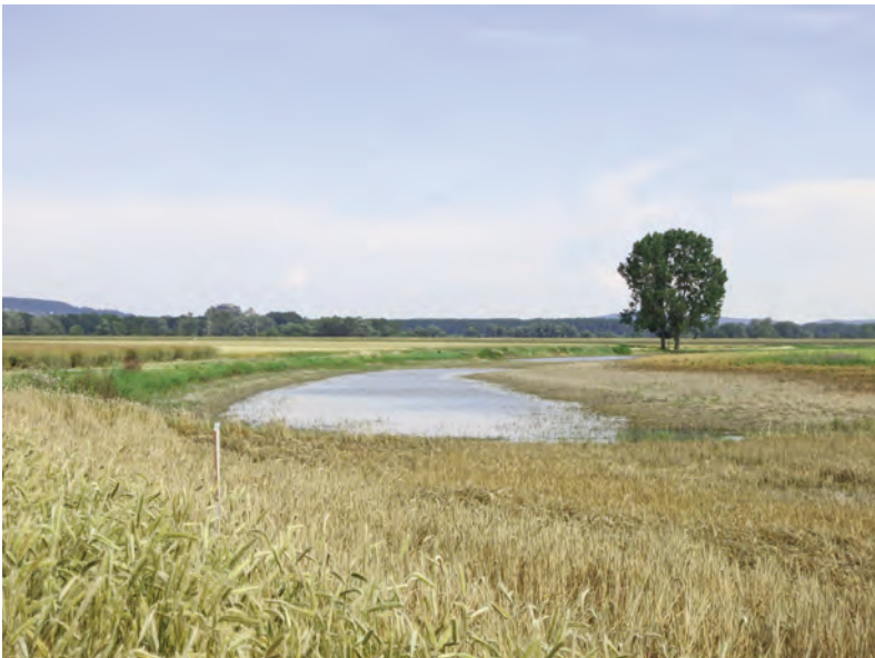
Abb. 2: Die Riemerkreuzsutte bei Markthof, Niederösterreich, Juli 2013. Im Zwickel zwischen Steffelbach, March und Donau gelegen, beherbergt dieses astatische Gewässer sechs Urzeitkrebse-Arten: Triops cancriformis , Branchipus schaefferi , Limnadia lenticularis , Limnadia yeyetta , Leptestheria dahalacensis und die seltene Eoleptestheria ticinensis .

Je nach Überflutungsdauer und Größe der Gewässer lassen sich verschiedene Leitartengruppen festmachen. So sind in Regenlacken, die nur wenige Tage lang Wasser führen, vorwiegend Mückenlarven in der Lage, ihre Entwicklung zu vollenden. Groß-Branchiopoden („Urzeitkrebse“) benötigen eine Wasserführung von wenigen Wochen, Amphibien von mehreren Wochen bis Monaten. Je nach Umgebungstemperatur sind diese Angaben variabel; die verschiedenen Artengruppen kommen oft auch gemeinsam vor.