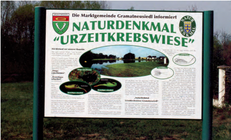
Abb. 8: Die vom 2014 verstorbenen Herbert Palme (Mikroskopische Gesellschaft Wien) gestaltete Informationstafel zum 1997 unter Schutz gestellten Naturdenkmal „Urzeitkrebswiese“ in der Feldgasse von Gramatneusiedl (Wiener Becken, Niederösterreich).