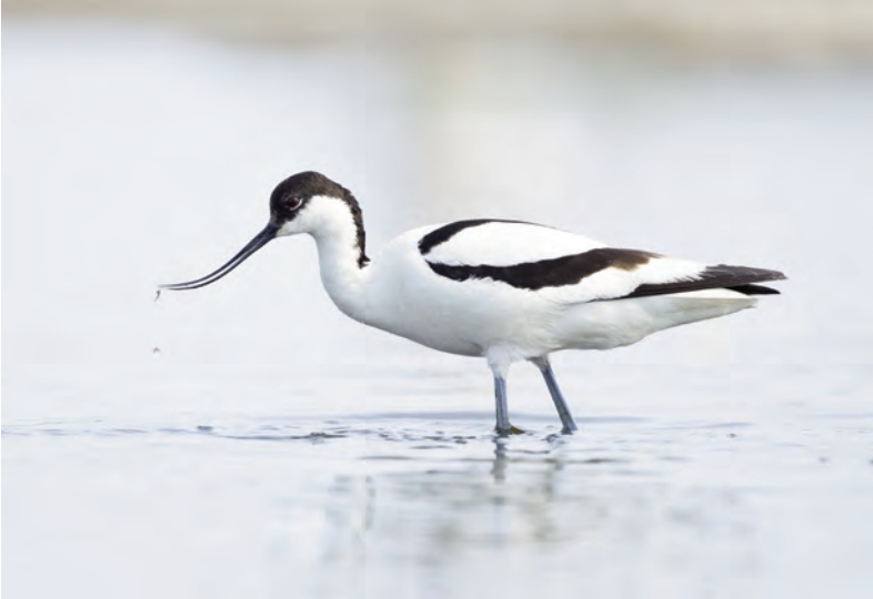
Abb. 11: Säbelschnäbler ( Recurvirostra avosetta ) im Seewinkel, Burgenland. Bei Massenvorkommen von Anostraken (z.B. Branchinecta orientalis ) ernähren sie sich fast ausschließlich von diesen Krebsen (vgl. WINKLER 1980).