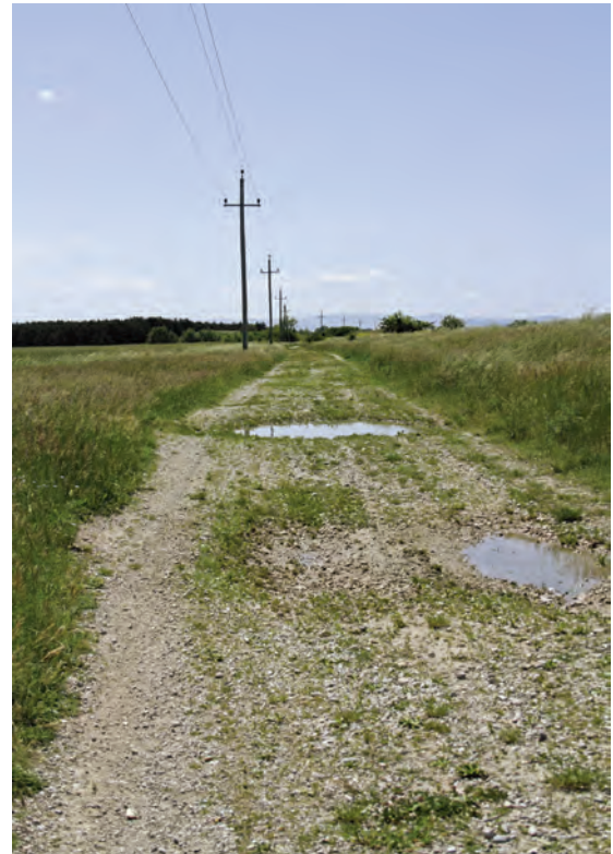
Abb. 3: Weglacken bei Theresienfeld (Wiener Neustadt, Niederösterreich), ein typisches Vorkommen von Branchipus schaefferi , Mai 2014.

Die wohl originellste Tiergruppe der ephemeren Gewässer stellen die Groß-Branchiopoden oder „Urzeitkrebse“ dar. Vielfach sind sie als „Lebende Fossilien“ bekannt, da sich ihr Aussehen seit dem Oberen Kambrium fast nicht verändert hat (WALOSSEK 1995). Mit dem Auftauchen der ersten Fische im Devon neigte sich ihre Ära in den Meeren und Seen dem Ende zu, übrig blieben die astatischen Gewässer (BELK 1996). So lassen sich heutzutage Vertreter dieser Gruppe in den unterschiedlichsten Lebensräumen, von den Salzpfannen und Sodalacken, über periodische Gewässer von Mitteleuropa bis hinauf in die Arktis (BRTEK & THIÉRY 1995) finden. Eines haben alle „Urzeitkrebse“-Habitate gemeinsam: Ihr Biotop muss kurzfristig verschwinden, um wieder lebenswert zu werden.