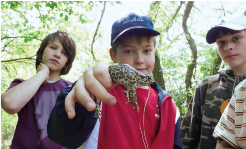
Abb. 9: Hautnaher Kontakt mit einer Wechselkröte ( Bufo viridis ) sorgt für Faszination bei Schülern. Biologische Station Marchegg, 28. April 2009.