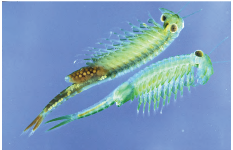
Abb. 4: Der seltenste heimische Feenkrebs, Chirocephalus shadini , war 1982 Grund für die weltweit erste Unterschutzstellung eines Urzeitkrebsevorkommens, der Tümpelwiese beim Marchegger Pulverturm, Niederösterreich.

In Österreich wurden 16 Arten aus den Ordnungen Anostraca, Notostraca sowie „Conchostraca“ (i.e. Laevicaudata und Spinicaudata) nachgewiesen.