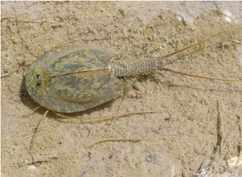
Abb. 5: Der Rückenschaler Triops cancriformis auf einem überfluteten landwirtschaftlichen Weg in Marchegg Bahnhof, Niederösterreich, 10. Juni 2010.