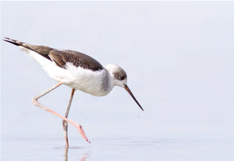
Abb. 12: Der mit dem Säbelschnäbler nahe verwandte Stelzenläufer ( Himantopus himantopus ) im Seewinkel (2013), wo diese Art seit den 1990er Jahren wieder brütet.