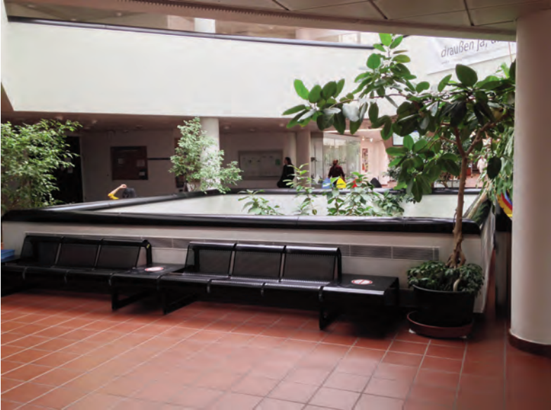
Abb. 17: Geschlossene Räumlichkeiten werden vorwiegend von einigen wenigen, eingeschleppten Langfühlerschrecken besiedelt wie hier von Acheta domestica und Gryllodes sigillatus (Biologiezentrum/W, 165 m, 5.4.2017, L. Reiss).