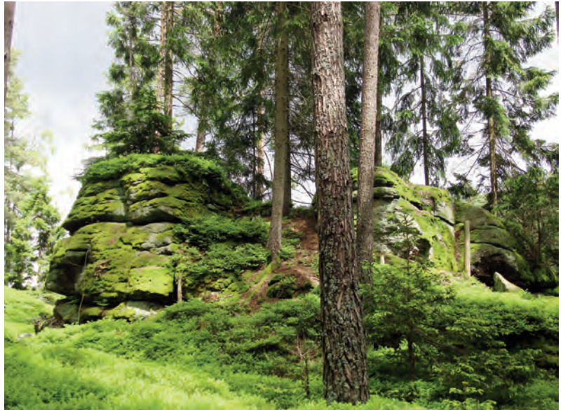
Abb. 3: Nadel- und Mischwälder des Nördlichen Granit- und Gneishochlands sind Lebensraum der einzigen reinen „Waldschrecke“ Österreichs, der Nadelholz-Säbelschrecke Barbitistes constrictus (1.6.2013, 700 m, Rappottenstein).

cogryllus bordigalensis – in Österreich in Feldkulturen. Die deutschen Namen dieser drei „Ackerschrecken“ deuten darauf hin, dass Anpassungen an offen-trockene Steppenlandschaften beim Überleben im Ackerland hilfreich sind. Eine Eiablage in den Boden ist jedenfalls aufgrund der vollständigen Entfernung des oberirdischen Aufwuchses hier obligatorisch, außer die Feldlandschaft ist kleinteilig und durch Landschaftselemente (meist aus den „Biotoptypen“ der strauchigen und krautigen Lebensräume) als Rückzugstreifen gegliedert. Am häufigsten sind neben den Heupferden