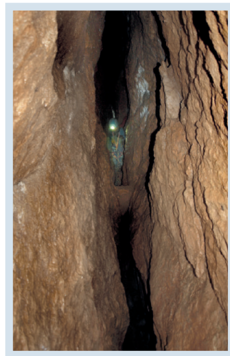
Abb. 3: Für die Buchenhöhle typische, schmale, kluftgebundene Gangform.

Plan: Johannes Mattes (nach Entwürfen von Dietmar Kuffner und Barbara Wielander)