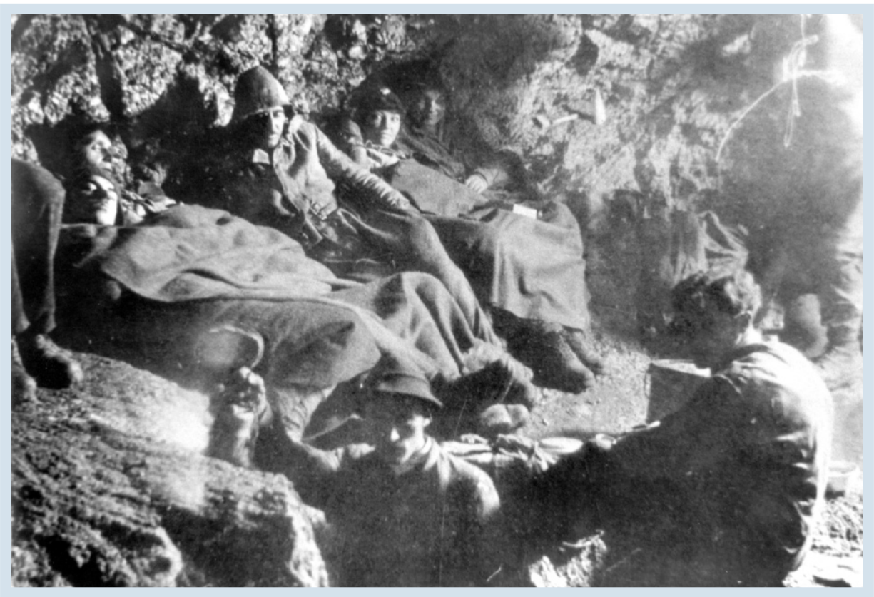
Abb. 2: Mitternachtsrast im Unteren Horizontalsystem der Gassel-Tropfsteinhöhle .