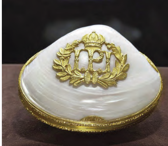
Abb. 1: „Dom Pedro Dose“ – Tabatiere aus polierter Körbchenmuschel.

ab 1842: Ankäufe seltener Mollusken von Hugh Cuming aus London [englischer Malakologe, Sammler und Händler] (ca. 500 Serien)