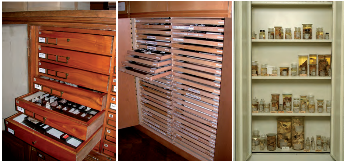
Abb. 3a-c: Unterschiedliche Aufbewahrungssysteme in der Molluskensammlung: a – Alte Sammlungsladen (bis auf die historischen Sammlungen bereits ersetzt), b – Neue Sammlungskästen mit flexiblem Ladensystem in der Trockensammlung, c – Aufbewahrung der Feuchtpräparate im Tiefspeicher.