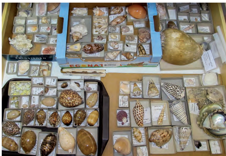
Abb. 7: Die wissenschaftliche Sammlung der marinen Schnecken und Muscheln ist bisher nur grob geordnet und nicht in der Datenbank aufgenommen; Foto: Haus der Natur.

gesammelten Mollusken, großteils handelt es sich um Schalen terrestrischer Gehäuseschnecken, wurden 2016 an die Molluskensammlung am Haus der Natur übergeben (SCHRATTENECKER-TRAVNITZKY & PATZNER 2016). 621 Datensätze mit 51 Taxa von 126 Fundorten wurden in der Salzburger Biodiversitäts-Datenbank inventarisiert.