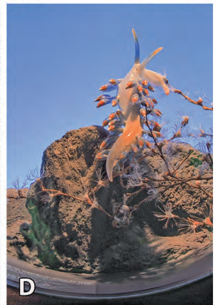
Abb. 2: Neue Schausammlung. – A: Diorama „Weiche Geschöpfe mit harter Schale – Schnecken und Muscheln im Mittelmeerraum“; – B: Vitrine „Die größten Schnecken und Muscheln tropischer Meere“; – C: Vitrine „Schnecken: Weidevieh, Aasfresser und Räuber der Meere“; – D: Kleindiorama „Die Fadenschnecke ( Cuthona caerulea ) und ihr ‚gestohlenes Gift‘“; Fotos: Haus der Natur.