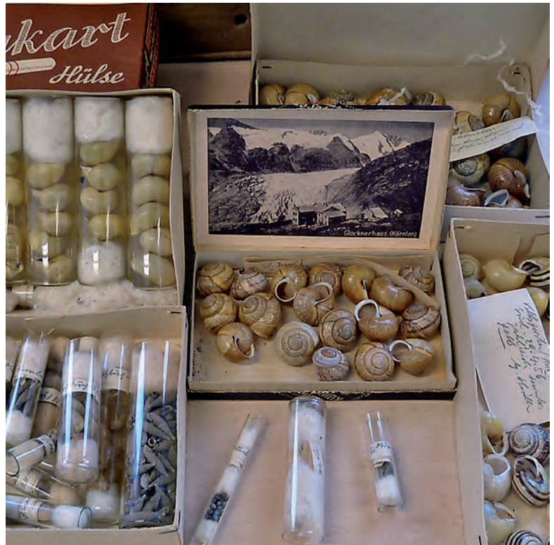
Abb. 5: Sammlung Schüller mit nicht determinierten Proben aus Salzburg mit genauen Fundangaben; Foto: Haus der Natur.

Zusätzlich zum Schalenmaterial wurden auch viele Exemplare in Alkohol konserviert. Von größeren Arten nur die Weichteile (die Schalen in der Trockensammlung), von kleineren die gesamten Tiere. Je nach Menge