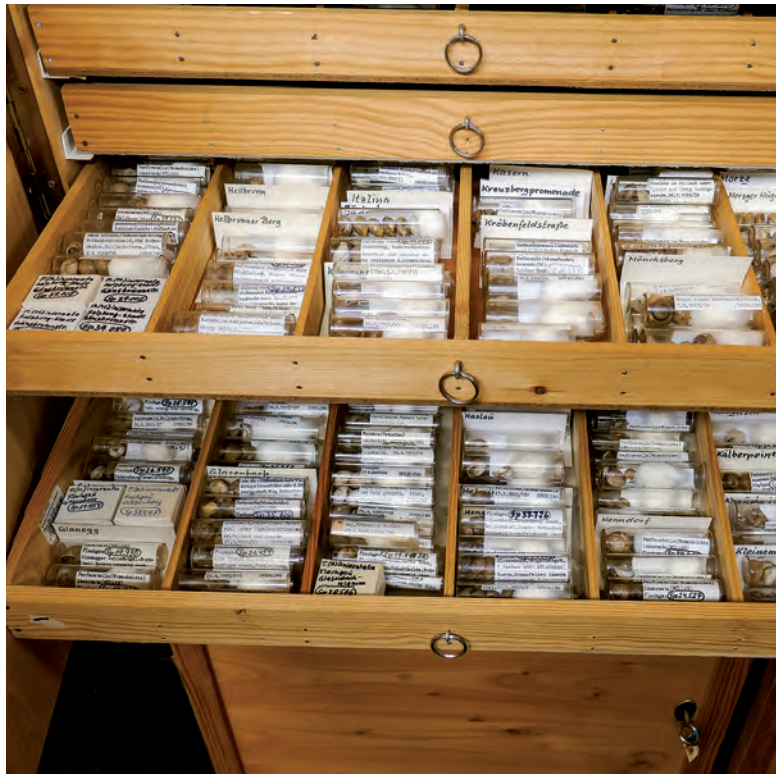
Abb. 6: Die Sammlung Sperling ist heute in den Originalboxen systematisch gegliedert und innerhalb der einzelnen Arten übersichtlich nach Fundorten geordnet; Foto: Haus der Natur.