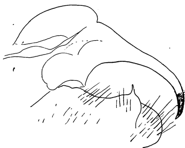
Fig. 10. Hirsutis caissara Zik. ♂ Genitalia. Espirito Santo