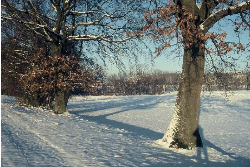
Foto 3: Zwischen Bannholz und dem Weiler Hilbern liegt ein durch Feldgehölze, Kleinwaldflächen, Fettwiesenstreifen und Einzelbäume struktureicher Bereich, der ehemalige Bachlauf ist allerdings verrohrt. Flächen 296 – 306.