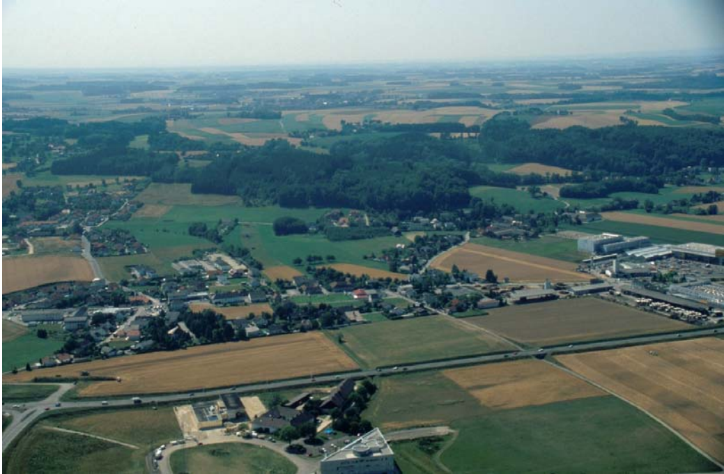
Flugb. 4: Intensiv besiedelter Bereich um Dietachdorf: Blick von Osten. Die Grenze zu Steyr verläuft im linken Bild Drittel – Zusammenwachsen der Orte. Links im Mittelgrund kleine, wertvolle Reste einer früher ausgedehnten Feuchtgebietszone (Flächen Nr. 249 – 252).