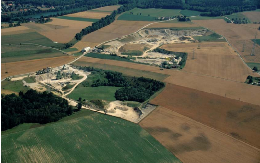
Flugb. 6: Die beiden Schottergruben bei Staning, Blick gegen SE. Man beachte den aufgelassenen Bereich in der vorderen Grube – Potential zur Entwicklung wertvoller Lebensräume. In dieser Grube auch Uferschwalben. Links Abhang von einem Hochterrassensporn mit mageren Brachen, bzw. schon mehr oder weniger geschlossen bewaldeten Bereichen.