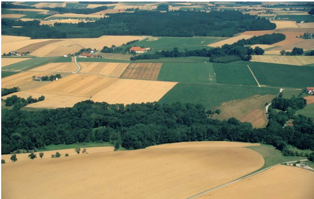
Flugb. 1: Im Vordergrund der Simsenbergbach, dahinter der mit naturnahem Laubwald bestockte Hang, anschließend eine Magerbrache- und wiese (vgl. Fotos 8 und 9), anschließend in der Feldflur die Gehöfte von Thann, dahinter das Bannholz, überwiegend Fichten – Monokultur.