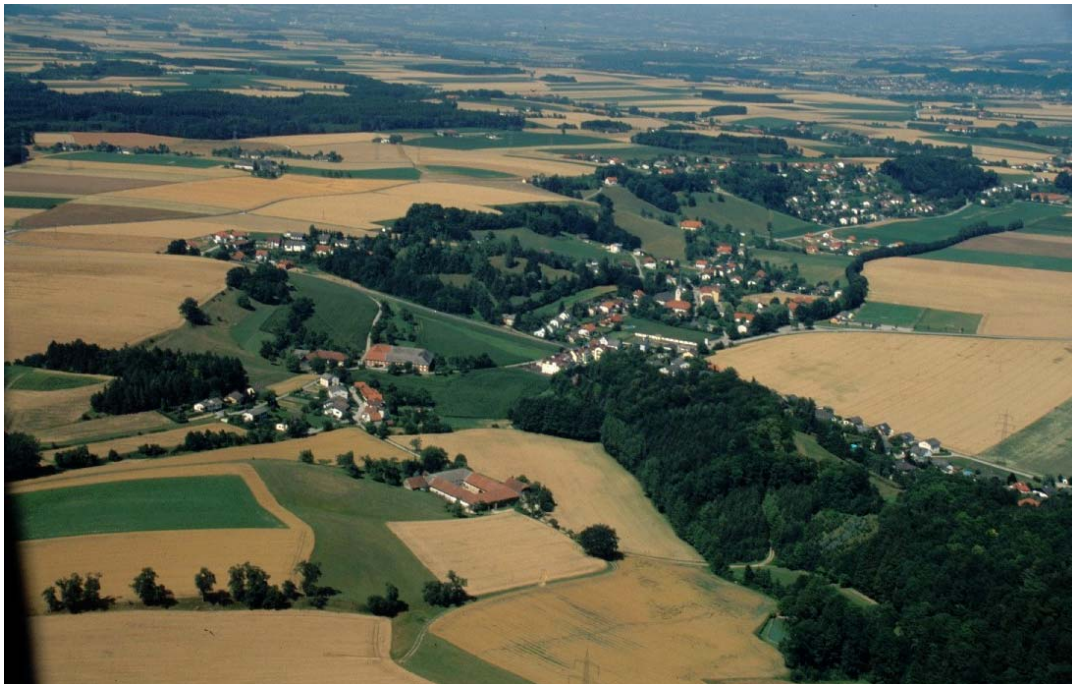
Flugb. 5: Dietach, Ort. Im Vordergrund Bauernhäuser mit Wiesen und Weideflächen an den Abhängen, die die Grenze der Landschaftseinheiten bilden. Links und hinter dem Ortskern der Heuberg. Die unverbauten Bereiche sind gut strukturiert und weisen wertvolle Grünlandstandorte auf.