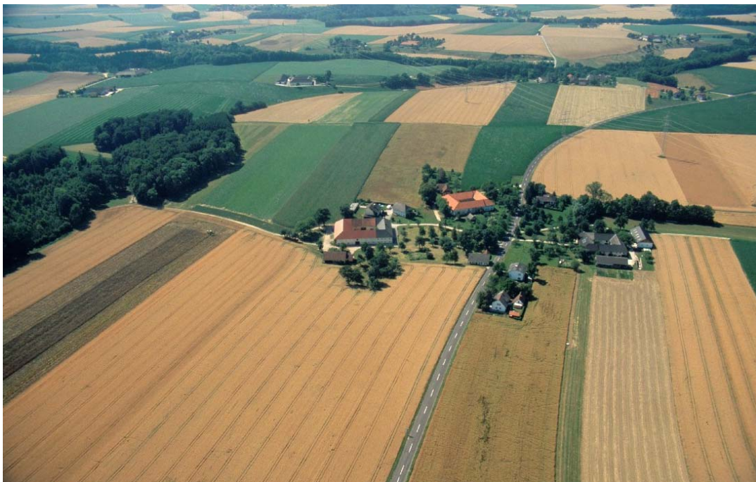
Flugb. 3: Weiler Hilbern. Streuobstbestände sind das wesentlichste Wertmerkmal der Weiler und Gehöfte.