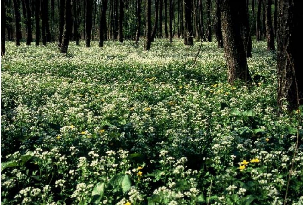
Foto 1: Au des Penkinger Bachs (= nördliche Fortsetzung des Simsenbergbachs). Schwarzerlen dominieren in der Baumschicht. Blühaspekt von Behaartem Kälberkropf Chaerophyllum hirsutum . Frühjahr 1997.