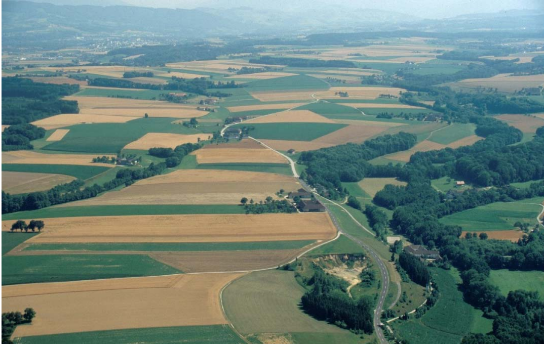
Flugb. 2: Blick vom Nordende des Gemeindegebiets nach Süden (der überwiegende Teil des Bildausschnitts gehört zur Gemeinde). Die Feldflur ist über weite Strecken ausgeräumt und strukturarm. Das Bild ist typisch für das Teilgebiet 1, das landwirtschaftliche Intensivgebiet auf dem Plateau aus Älteren und Jüngeren Deckenschottern. Rechts das Tal des Simsenbergbachs, links sind die Ufergehölze des Thanner Bachs erkennbar.