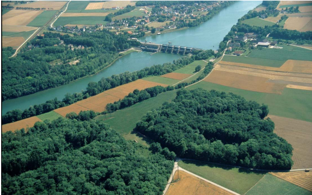
Flugb. 8: KW Staning von NW. Im Vordergrund naturnaher Laubwald auf der Niederterrasse.