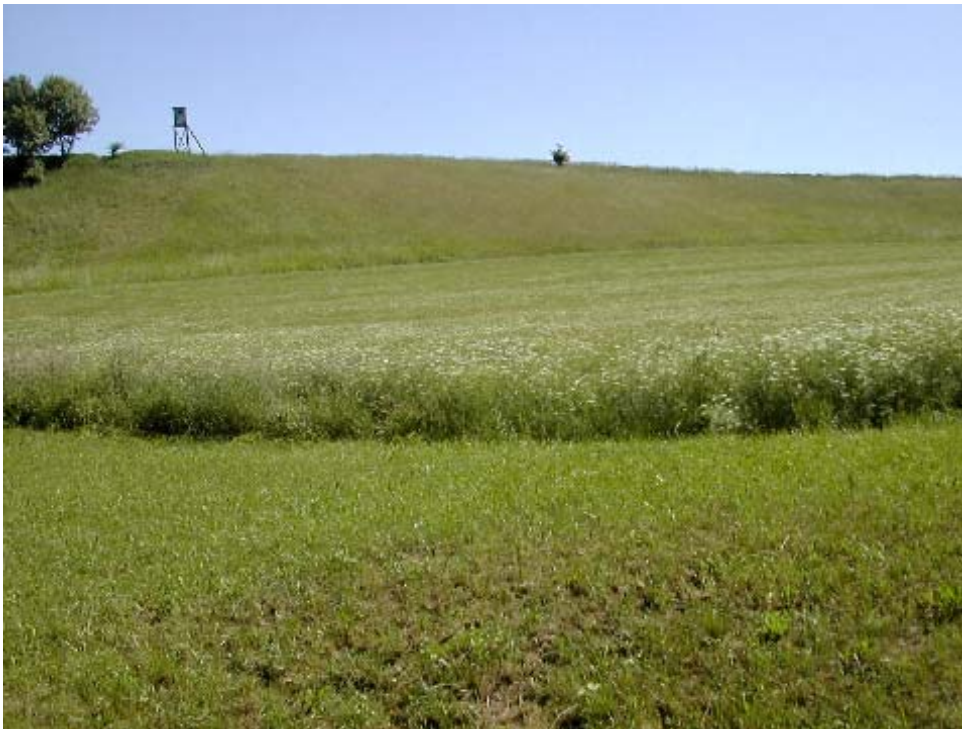
Foto 2: Diese Magerwiese wird zwar zum Großteil noch gemäht, das Mähgut wird aber nicht mehr abtransportiert. Der linke Teil ab dem Hochstand verbracht und beginnt zu verbuschen. Vgl. auch Foto 9! Frühjahr 2002. Fläche 399 und 400.