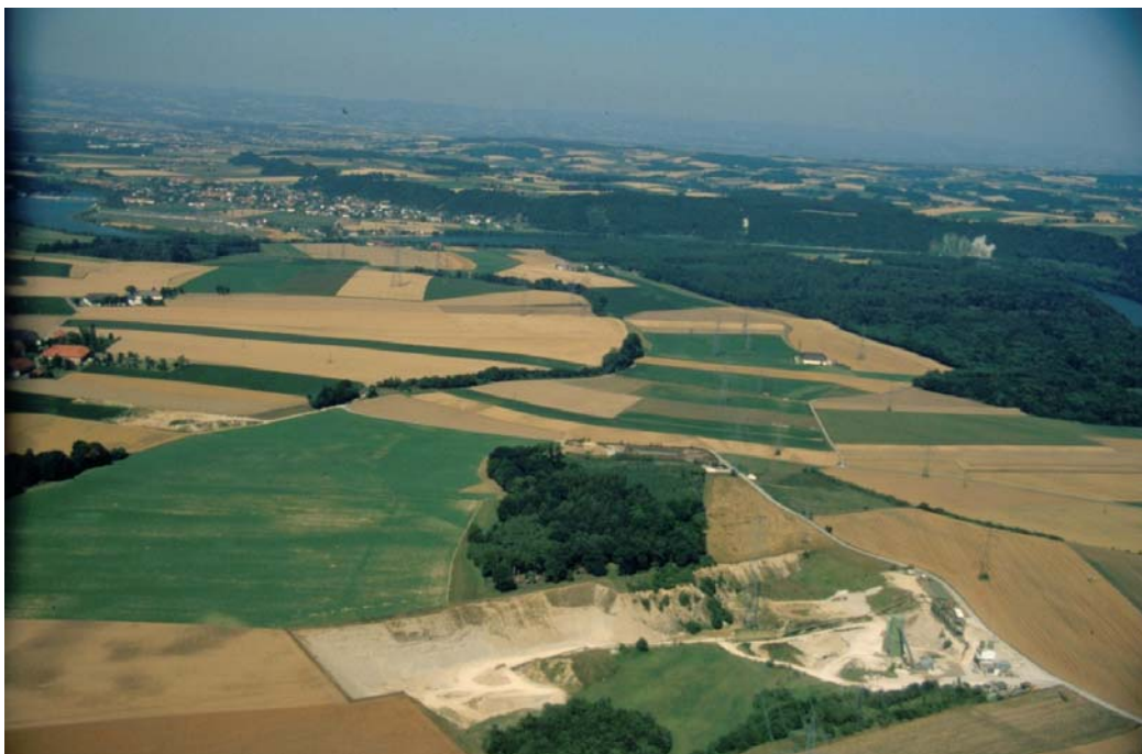
Flugb. 7: Nördliche Schottergrube bei Staning, Niederterrasse, Böschung zur Hochterrasse mit Brachen, Verbuschung, Bewaldung. Anschüttung und Einebnung eines Teils der Böschung. Gemeindegrenze vor dem rechten Vierkanter bzw. an der oberen Böschungskante.