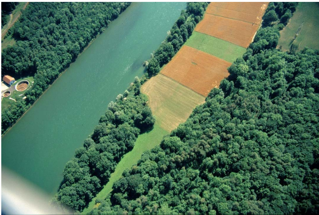
Flugb. 9: Kleiner Auwald im Unterwasser des KW Staning. Der breitere Bereich ist eschendominiert und wurde 2002 kräftig überschwemmt.