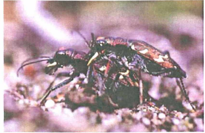
Cicindela sylvatica