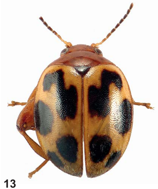
Abb. 11-13: (11) Exochomoscirtes rutai nov.sp., Habitus, dorsal; (12) Exochomoscirtes herthae nov.sp., Holotypus, Habitus, dorsal; (13) Exochomoscirtes herthae nov.sp., Paratypus, Habitus, dorsal.

Der 7. Tergit (Abb. 5) besteht aus einer breiten Platte und kräftig sklerotisierten schmalen Bacilla lateralia. Maximale Breite des 7. Tergit 0,60 mm; Länge der Platte in der Mitte 0,45 mm; Länge der Bacilla lateralia (ohne Berücksichtigung der Krümmung) 0,45 mm.