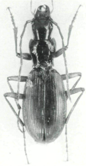
Abb. 5 (links): Überrest einer alten Rotbuche am Mühlbacherkogel bei Rein (NW Graz). Abb. 6 (rechts): Der Höhlenlaufkäfer Antisphodrus schreibersi styriacus aus der Lurgrotte bei Peggau.

Mischwald und damit die tiefen Laublagen in den dortigen Dolinen nicht erhalten blieben (Unter-Schutz-Stellung dringend nötig).