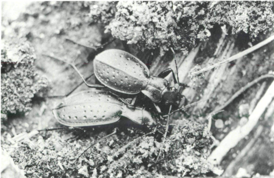
Abb. 4: Der Großlaufkäfer Carabus irregularis – ein typisches Bergwaldtier, in einem Baumstrunk überwinternd. (1,5-fach vergrößert)

Noch ein besonderes Reliktvorkommen ist in diesem Zusammenhang anzuführen. Dieses liegt im Bereich des Schloßberges bei Wildon (Buchkogelzug): in einem dortigen Mischwaldbestand mit hohem Rotbuchenanteil konnte gleichfalls ein Restbestand einer präglazialen Bodenfauna festgestellt werden. Es handelt sich hier um das nördlichste Vorkommen einer Art aus einer bestimmten, sehr typischen Blindkäfergruppe (Bathysciinae), nämlich um Bathysciola silvestris MOTSCH. Auch dieses sehr kleinräumige Reliktvorkommen würde vernichtet werden, wenn der