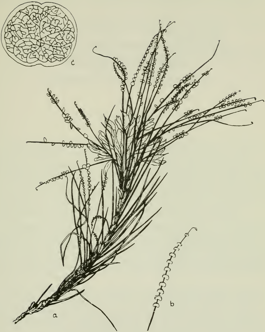
Astragalus peltatus Podl. et Deml (PODLECH 11164) a) Habitus, ca. 1/2 nat. Größe, b) Blatt, nat. Größe c) Blättchen, auseinandergefaltet, 7 x vergrößert