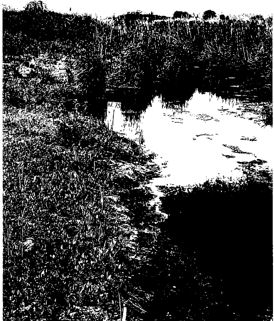
Abb. 2: Schwemmanalysenstelle KE7S am 18.05.1983 am Kehrgraben bei St. Leon-Rot, Fundplatz von 5 Männchen und 3 Weibchen von Carpelimus gusarovi .