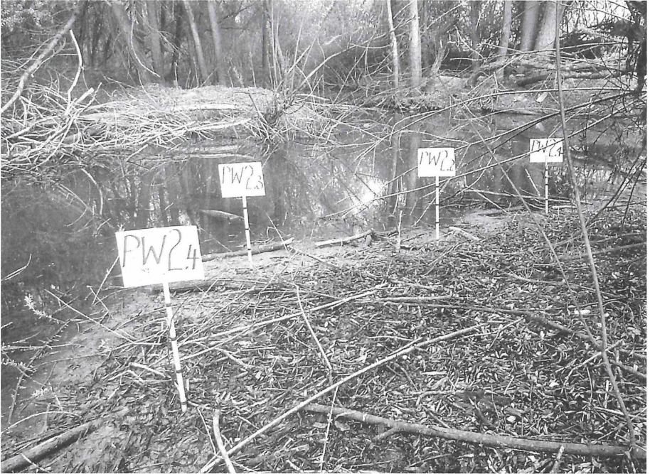
Abb. 1: Probengruppe PW2 am 05.05.1984 im NSG Pleidelsheimer Wiesental. Die 4 hier entnommenen Bodenproben enthielten 39 Käferarten, darunter die für Deutschland erstmals nachgewiesene Art Carpelimus gusarovi . Sie war in dieser Probengruppe mit weiteren 7 Carpelimus -Arten vergesellschaftet.