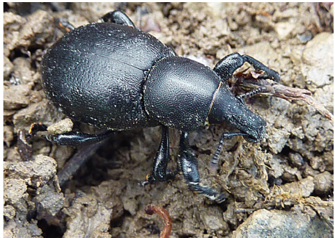
Abb. 15: Großer Haarstrang-Rüsselkäfer ( Liparus dirus ), Curculionidae; 7.8.10