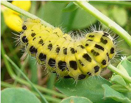
Abb.9: Raupe des Klee-Widderchen ( Zygaena lonicerae ), Zygaenidae; 16.6.10