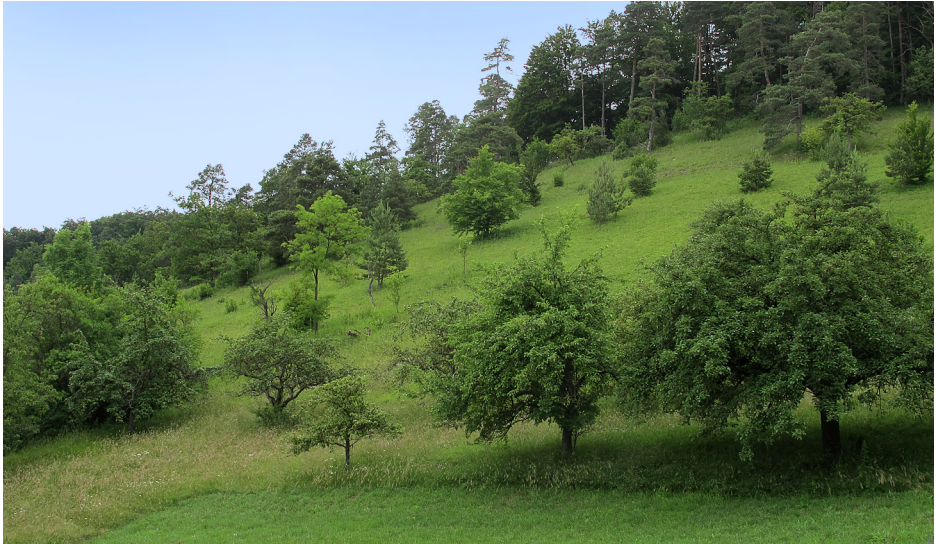
Abb. 6: Das NSG am 4. Juli 2013