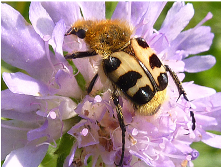
Abb. 14: Der seltene Glattschienen-Pinselkäfer ( Trichius sexualis ), Scarabaeidae; 16.6.10