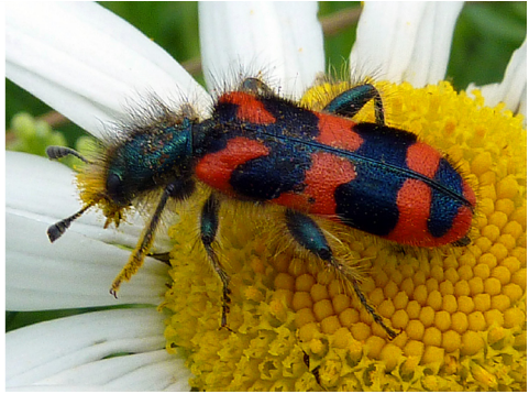
Abb. 13: Bienenwolf ( Trichodes alvearius ), Cleridae, Buntkäfer; 29.5.10