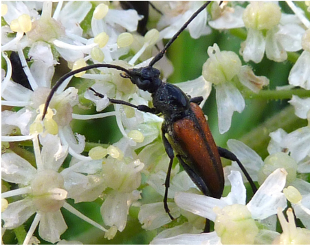
Abb. 12: Männchen des Kleinen Schmalbocks ( Stenurella melanura ), Cerambycidae; 28.6.10