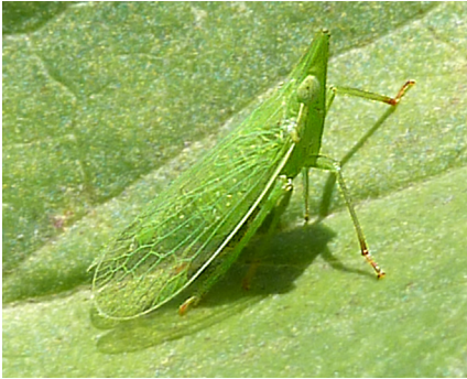
Abb.7: Europäischer Laternenträger ( Dictyophara europaea ), Dictyopharidae; 28.6.10