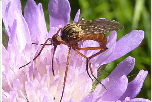
Abb.8: Tanzfliege aus der Familie Empididae; 5.6.10