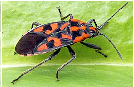
Abb.10: Der „Knappe“ ( Spilostethus saxatilis ), Lygeidae, Bodenwanzen; 2.9.10