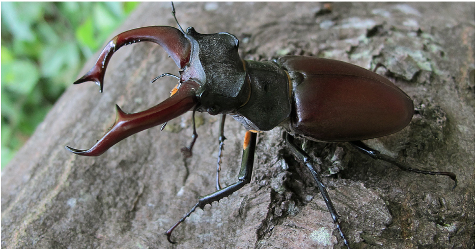
Abb. 16: Hirschkäfer ( Lucanus cervus ), 4.6.13; Foto: J. Reibnitz.