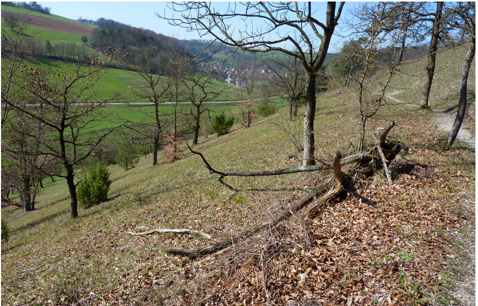
Abb. 1: Das NSG am 7. April 2010; im Hintergrund Crispenhofen

Die Untersuchung des Naturschutzgebietes dauerte vom 24. März bis zum 6. September 2010. In der kurzen Zeit konnten – ich war alleine tätig – nur ein kleiner Teil der im Gebiet vorkommenden Insekten erfasst werden, zumal keine Fallen zum Einsatz kamen. Eine Sammelausnahmegenehmigung liegt vor.