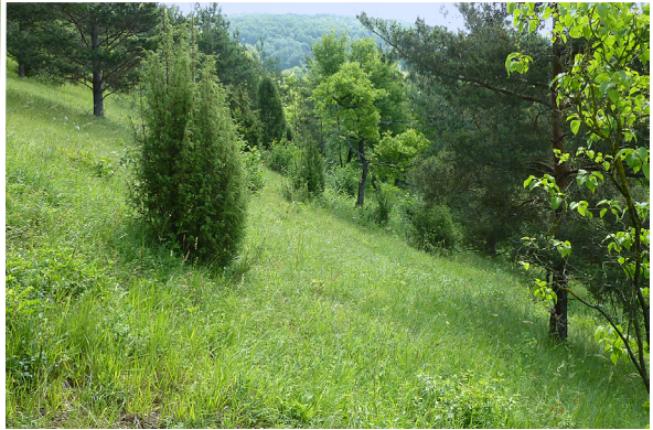
Abb. 4: Bocks-Riemenzunge ( Himantoglossum hircinum ), Mai 2010