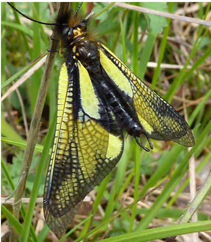
Abb.11: Libellen-Schmetterlingshaft ( Libelloides coccajus ); 11.5.10