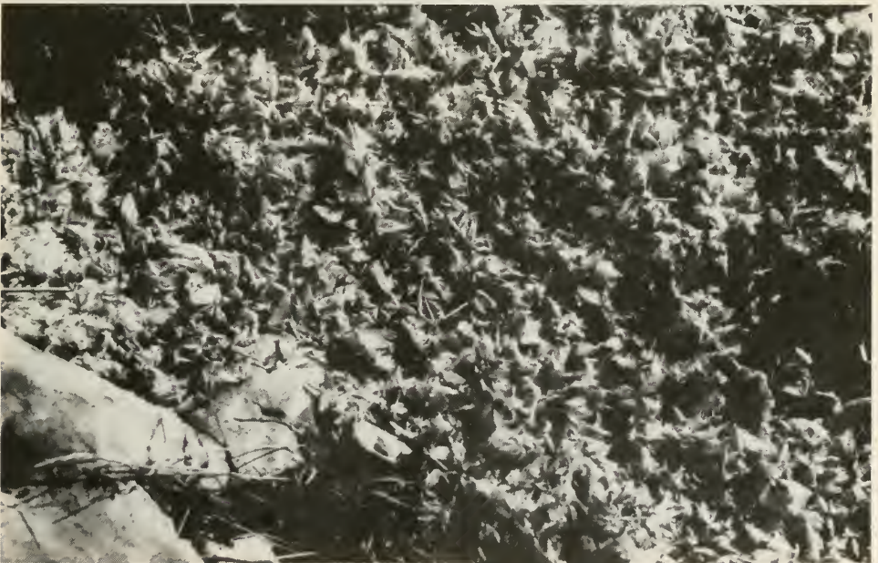
Abb. 2. Ansammlung toter Individuen (meist ♀♀) von Ephoron virgo OL. an den Scheinwerfern, die nachts das römische Aequeduct anstrahlen.