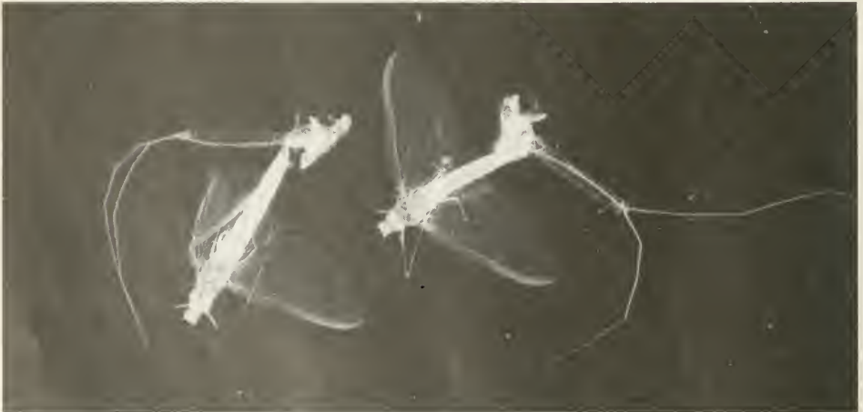
Abb. 4. Männliche Individuen von Ephoron virgo OL. mit anhängenden Subimaginal-Häuten, in denen die Cerci noch stecken. Diese Häute werden im Fluge mitgetragen und erst während der Kopulation abgeworfen.