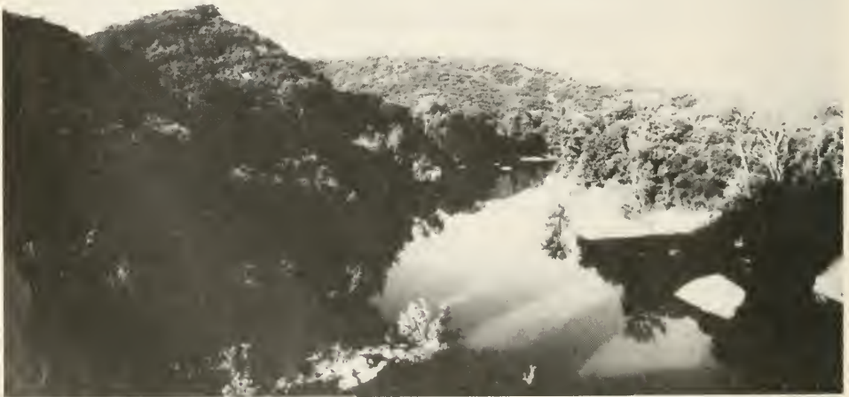
Abb. 1. Der Fluß Gard bei Remoulin (Nimes). Blick vom Aquaeduct Pont du Gard (Fahrstraße) nach Nordwesten.