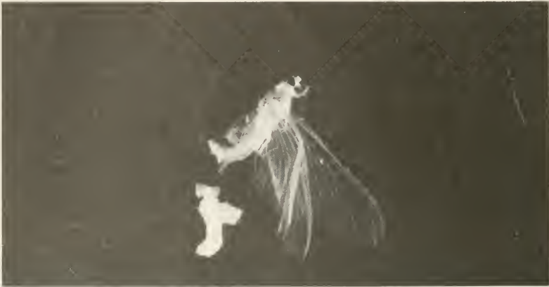
Abb. 3. Einzelnes weibliches Tier aus der Ansammlung toter Individuen von Ephoron virgo OL. mit herausgedrückten und gequetschten Eipaketen.

Der Schlupf der Tiere aus dem untersuchten Abschnitt des Flusses war nicht direkt, sondern nur aus dem Abfliegen der Subimagines zu erkennen. Wie bereits ULMER (1924) vermutet, häuten sich die Weibchen nicht weiter zur Imago, sondern sind in diesem Stadium nicht nur flugfähig, sondern auch geschlechtsreif. Die Konditionierung zeigt jedoch, daß diese Tiere sich bei Windstille nicht aus dem seitlich begrenzten aber naturnah erhaltenen Bereich entfernen. Hinweise von ULMER (1927), SCHOENEMUND (1930) und STADLER (1924) von Nachweisen eine größere Strecke vom Flußabschnitt