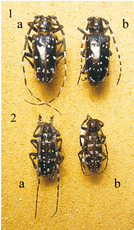
Abb. 1: 1 = Anoplophora chinensis (MOTSCHULSKY, 1853); 2 = Anoplophora glabripennis (FORSTER, 1771); a = Männchen, b = Weibchen.

Anoplophora glabripennis (MOTSCHULSKY, 1853), Asiatischer Laubholzbockkäfer (Abb. 1: 2a, b)