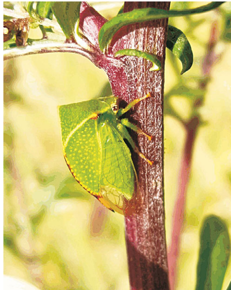
Abb. 3: Stictocephalus bisonia KOPP & YONKE, 1977.

In den gemäßigten Zonen Nordamerikas ist diese auffällige Buckelzikade (Membracidae) heimisch. In Europa, wo sie bereits Anfang des 20. Jahrhunderts eingeschleppt wurde (1912), findet man sie in jüngerer Zeit besonders häufig vor allem an der seit langem in Mittel- und Nordeuropa etablierten, ebenfalls aus Nordamerika stammenden Goldrute ( Solidago sp.). Diese Pflanze ist sowohl auf Ruderalflächen als auch an Fluß- und Bachufern häufig und hat ebenso die Niedermoore erobert. Um 1965 trat die Büffelzirpe im Oberrheintal gehäuft auf (HOFFRICHTER & TRÖGER 1973). Meldungen häufen sich seit etwa 10 Jahren im Raum München, sogar aus der Innenstadt, wo die Goldrute vorkommt. Inzwischen ist sie bis nach Nordafrika und Mittelasien vorgedrungen. Das abgebildete Tier stammt aus dem Burgenland (Österreich) und fand sich an Meerstrand-Wermut im Bereich des Seewinkels östlich des Neusiedler Sees.