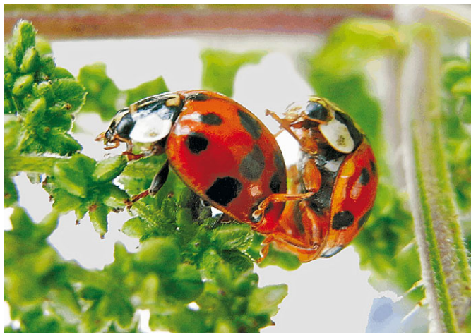
Die Abbildung zeigt Harmonia axyridis (PALLAS, 1771) bei der Paarung.

Im Herbst 2006 wurde München von einer Invasion des Asiatischen Marienkäfers geradezu überfallen. Ursprünglich ist der Käfer in Ostasien über die Mandschurei, Nordostchina, Korea, Japan bis Nepal verbreitet. 2007 war dann ein Massenvorkommen in ganz Bayern festzustellen, wobei die Variabilität dieser Käfer besonders auffiel. Offensichtlich handelte es sich um Tiere und deren Nachkommen aus Gewächshäusern, da sie dort ihre Fressaktivität an den schädlichen Blattläusen ausleben sollten, wie man dies erfolgreich in Nordamerika praktiziert hatte. Die Dichtig-