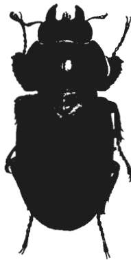
Abb. 2: Hirschkäfer-♀, Menden, ca.1955, Gesamtlänge 40,4 mm.

Es zeigt sich, daß 12 Nachweise aus den 50er Jahren stammen, 10 aus den 60er Jahren, 7 aus den 70er Jahren, 6 aus den 80er Jahren und nur 1 aus den 90er Jahren. Der Schluß, daß hier ein Rückgang stattgefunden hat, ist naheliegend, wenngleich nicht zwingend, wenn man den Zufallscharakter vieler Funde berücksichtigt. Der Nachweis aus dem vergangenen Jahr deutet immerhin an, daß die Art im Mendener Hügelland