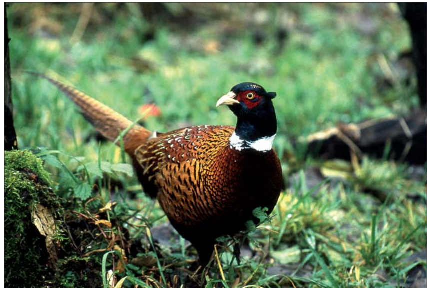
Abb. 1: Erste Hinweise auf Vorkommen des Jagdfasans in Österreich stammen aus dem 15. und 16. Jahrhundert.

Einen Überblick über die Zahl gebietsfremder Tierarten in Mitteleuropa gibt Tabelle 1; allerdings ist - besonders was die Insekten betrifft - der Kenntnisstand zwischen den an-