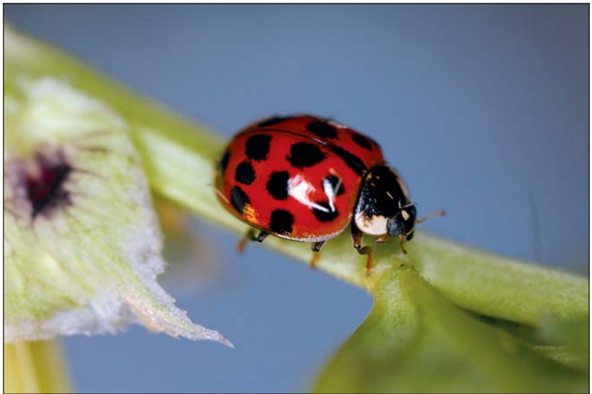
Abb. 5: Der asiatische Marienkäfer Harmonia axyridis wurde bisher noch nicht in Österreich festgestellt.

Es gibt keinen Zweifel! Biologische Invasionen werden weiterhin stattfinden. Deren Ausmaß und Auswirkung sind direkt von menschlicher Tätigkeit abhängig. Sowohl jeder Einzelne, aber auch die gesetzlichen Rahmenbedingungen können regulierend wirken. Öffentlichkeitsarbeit und Bewusstseinsbildung im „privaten“ Umfeld können für einen Rückgang mutwillig freigesetzter Tierarten (Ter-