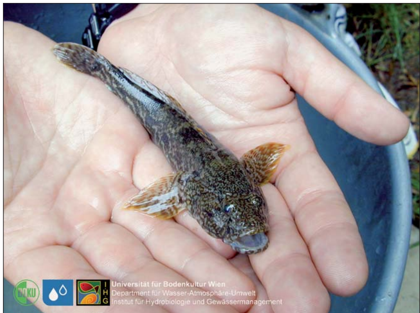
Abb. 4: Die aus dem Schwarzen Meer stammende Kesslergrundel ( Neogobius kessleri ) ist eine der häufigsten Fischarten in den Blockwurfhabitaten der Donau.

Biologische Invasionen werden als Folge der Veränderung von Lebensräumen und des steigenden Güter- und Personenverkehrs auch in Österreich zunehmen. Das bei den Neophyten beschriebene Phänomen des