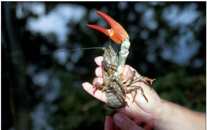
Abb. 7: Der aus Nordamerika stammende Signalkrebs Pacifastacus leniusculus ist in Österreich weit verbreitet. Als Überträger der Krebspest ist er eine Bedrohung für heimische Krebsarten.