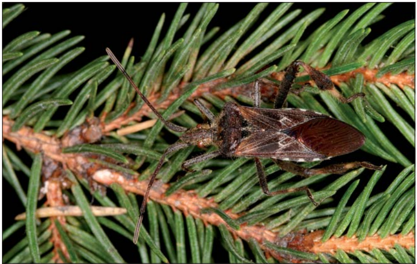
Abb. 6: Die aus Nordamerika stammende Randwanze Leptoglossus occidentalis wurde 2005 erstmals in Österreich festgestellt (RABITSCH u. HEISS 2005).