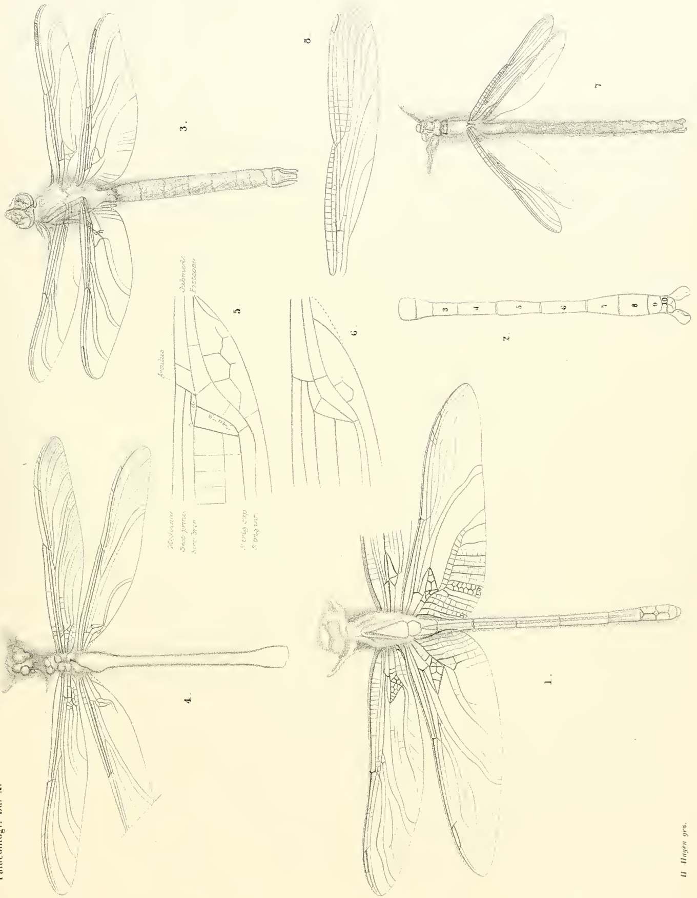
I. Petalia longialata Germ. ♀ — 2. Petalia longialata Germ. ♂ — 3. Petalia Münsteri Germ. — 4. 5. 6. Heterophlebia aequalis Hag. — 7. 8. Euphaea longiventris Hag.