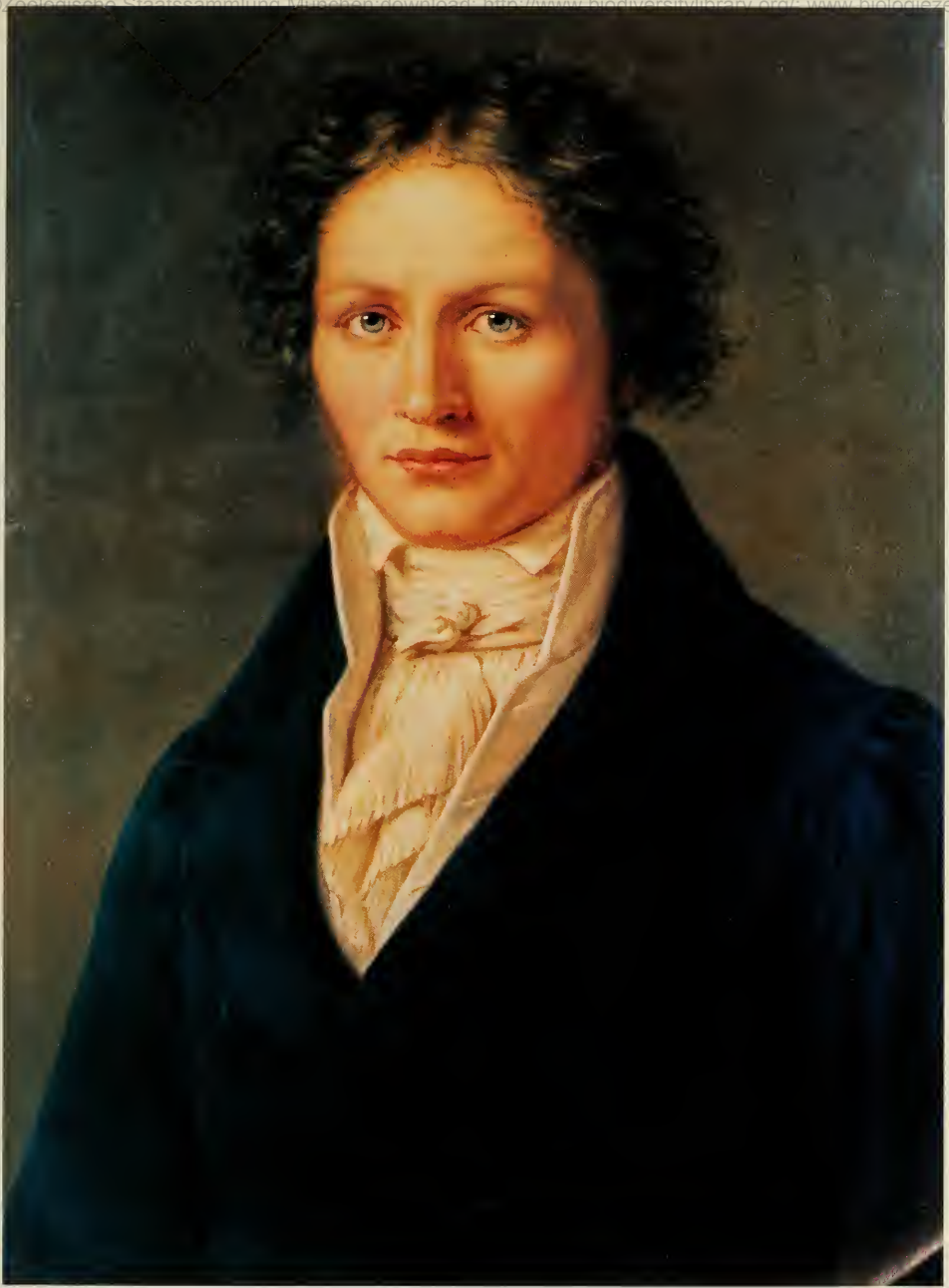
Original im Besitz der Bayer. Akad. d. Wiss., München