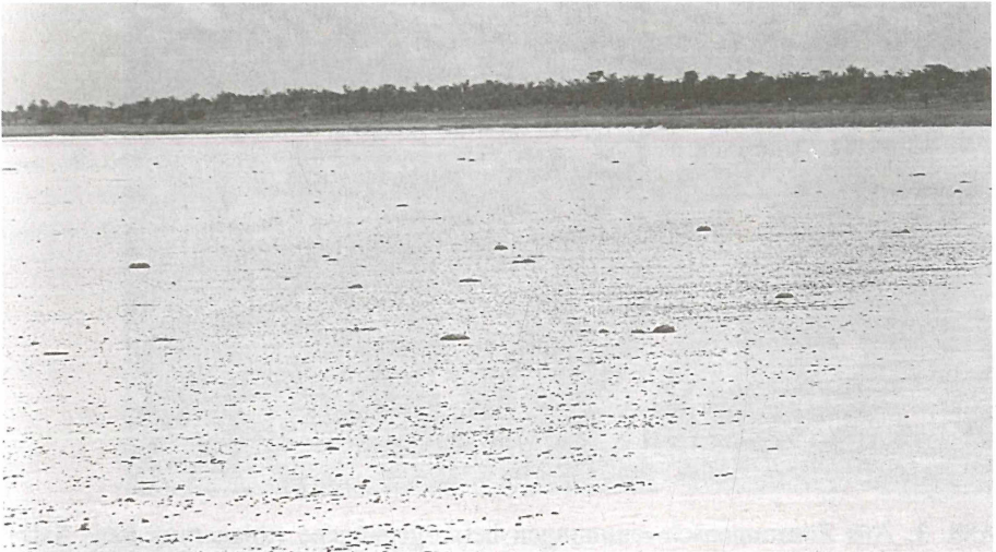
Abb. 2: Blick vom Salzkustenstrand gegen das Nordufer einer Salzpfanne mit weitflächigen organismischen Ablagerungen bzw. Salzkrusteneinbettungen.- (Foto: A. W. Steffan 2.3.1991)

skelette meist kleinerer Insekten, vor allem von Ameisen und Termiten. Solche Einbettungen kleinerer und auch mittelgroßer Insektskelette fanden sich auch weiter zum Ufer hin überall dort, wo Baumstamm-Reste oder Palmwedel-Rippen abgelagert waren und anscheinend Strömungsbarrieren dargeboten hatten, hinter denen an der Wasseroberfläche driftendes Material sich ansammeln konnte. Zwischen diesen und noch weiter zum Ufer hin fanden sich kleiner-flächige Einbettungsflecken, die meist nur aus einigen wenigen Exemplaren größerer Insekten oder z.B. auch Skorpionen bestanden. Noch weiter zum Ufer hin lagen einzeln oder zu zweit eingebettet die größten der aufgefundenen Gliedertiere, z.B. Hundert- und Doppelfüßer. In den der Fundbeobachtung und -Entnahme vorangegangenen Wochen war im Gebiet kein Regen gefallen, so daß die die Gliedertierskelette einbettende Salzkruste an der Oberfläche völlig starr und trocken war.