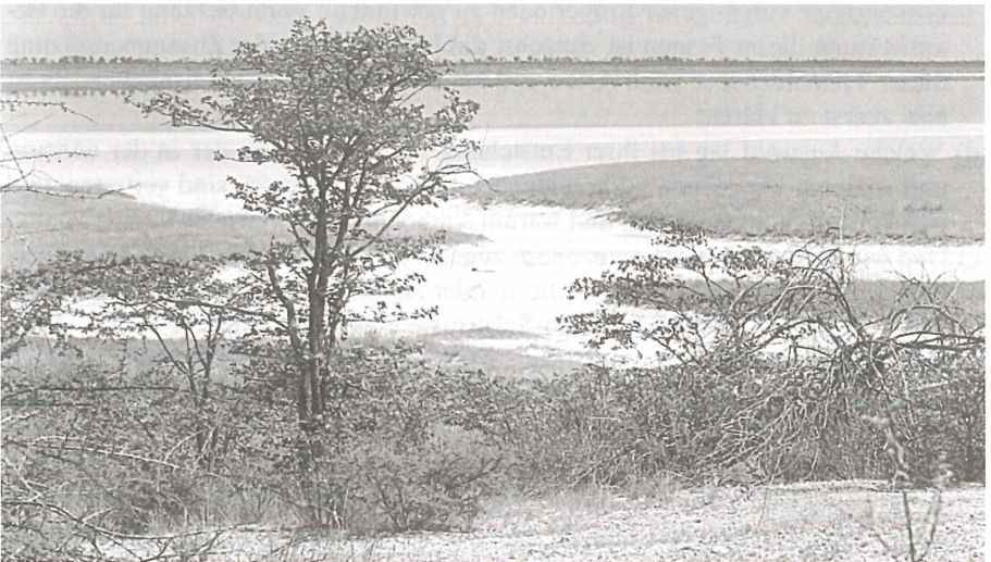
Abb. 1: Blick vom Nordufer auf eine im Zentrum wassergefüllte Salzpfanne mit breitem Salzkrustenstrand und sandigen Zulaufrienen im Vordergrund.

Nur am Nordufer erstreckte sich zum Sammelzeitpunkt zwischen dem wasser-gefüllten Pfannenzentrum und der Hangunterkante eine bis zu 800 m breite, ganz sanft geneigte ebene Strandfläche. Auch sie war zweifellos nach starken Regenfällen einige cm bis zu 1 m hoch mit Wasser bedeckt, das dann versickert oder verdunstet ist. Die etwa 300 m breite äußere (ufernahe) Zone dieser Strandfläche bestand aus einer trockenen, feinkristallinen Salzkruste, die innere dagegen aus einer nachgiebig-feuchten grobkristallinen. Unter der bis zu 1 cm dicken Kruste der äußeren Zone lag schwach feuchter, sandig-kalkiger Moder.