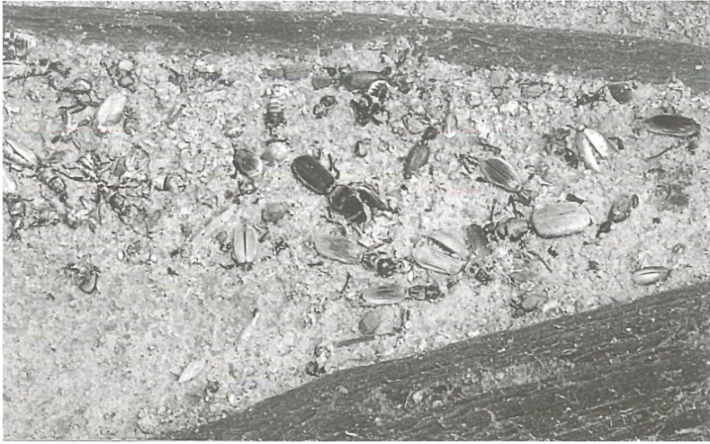
Abb. 4: Salzkrusteneinbettungen von anscheinend mehrfach umgelagerten Kerbtieren und Kerbtierresten im Strömungsschatten von größeren Baumstammresten.