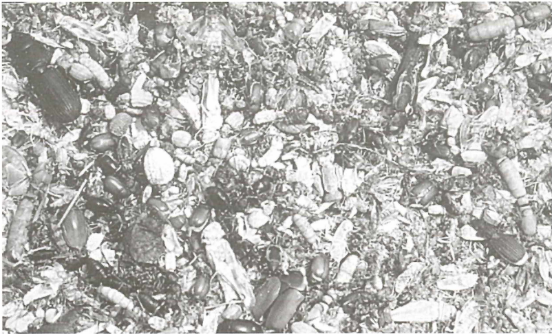
Abb. 3: Aus Zusammenschwemmungen hervorgegangene Ablagerung bzw. Salzkrusteneinbettungen von zahlreichen Vertretern verschiedener Kerbtierordnungen.- (Foto: A. W. Steffan)

päischen Laborbedingungen zerfallen. Die auf diese Weise freigewordenen einzelnen Individuen ließen noch einwandfrei die Einbettungslage erkennen, aber nicht mehr die ursprüngliche Ausrichtung am Einbettungsort und die Ausrichtung zueinander. Die freigewordenen Tiere bzw. die erhaltenen Skelettreste erlaubten aber dann eine Betrachtung von allen Seiten und damit die leichtere Determination. Die Bestimmungsarbeiten wurden ganz überwiegend erst 1996 durch einen der Verfasser (André Mursch), vorgenommen. Die ursprüngliche Lage und Ausrichtung der eingebetteten Tiere kann noch anhand von Farbdiapositiven und Farblichtbildern (Foto: A. W. Steffan 1991-03-02/-03) vorgenommen werden. Zur Klärung weiterer Fragen sind neue Aufsammlungen subfossiler Exemplare sowie Lebendfänge von Insekten in der weiteren Umgebung der Thanatozönose vorgesehen.