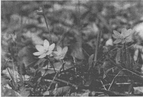
Abb. 3: Eine Charakterpflanze der Buchenwälder des NSG ist im Frühjahr das Leberblümchen Hepatica nobilis MILL. Aufnahme Ende April 1992.