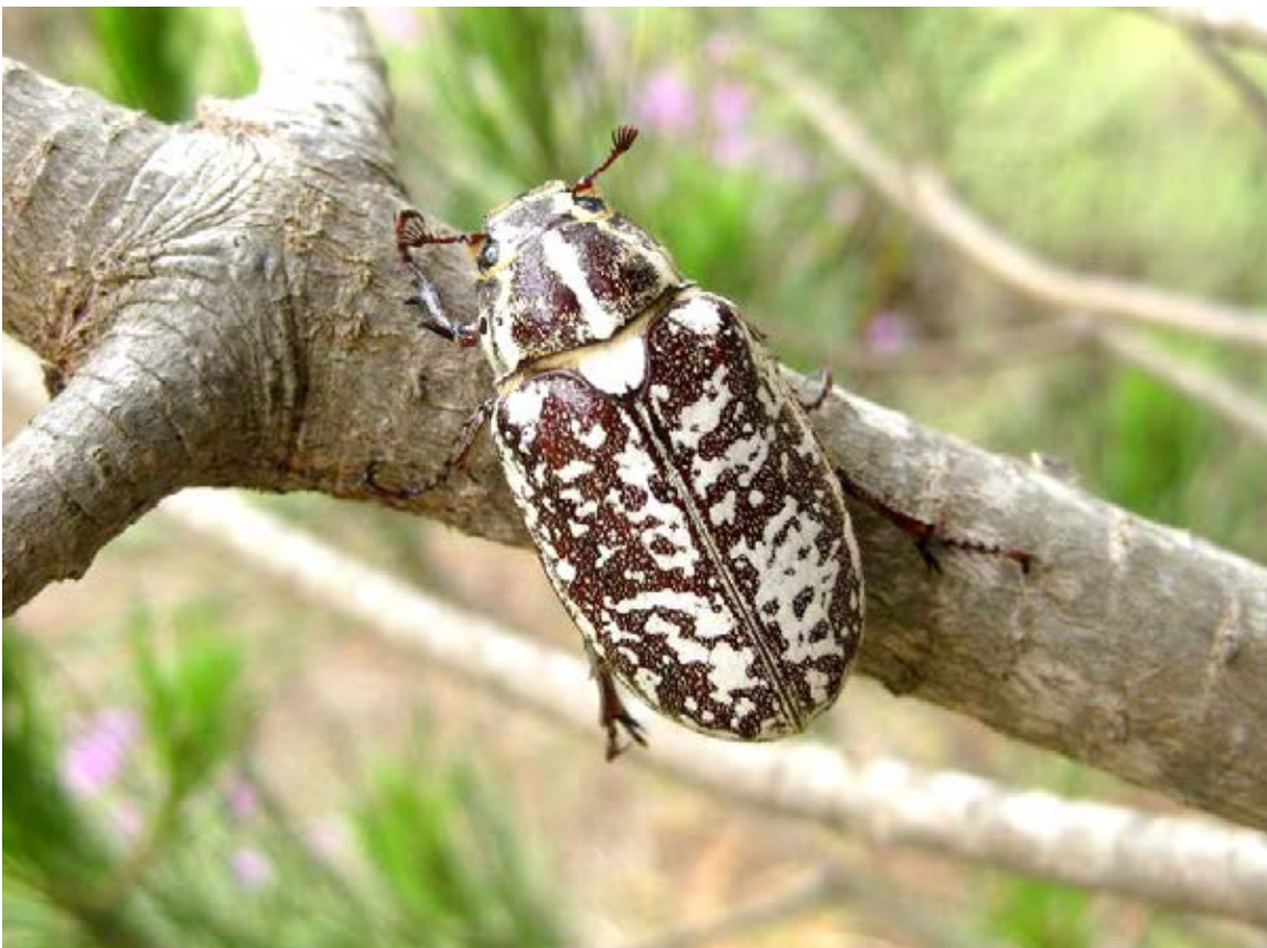
Abb. 13. Das Weibchen des Walkers Polyphylla fulvo (L.) (35 mm).