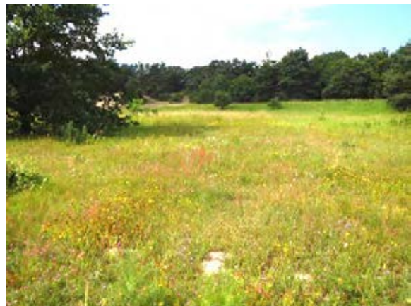
Abb. 3: Magerrasenfläche im Untersuchungsgebiet.

Sehr bemerkenswert ist hier am Bollenberg das Vorkommen des überall sehr seltenen Bockkäfers Phytoecia virgula (9 mm), des Walzen-Halsbocks (Abb. 9). Er ist eine sehr xerotherme Art und entwickelt sich in den Stengeln vom Rainfarn ( Tanacetum ) und Schafgarbe ( Achillea ). Er ist hochgradig gefährdet (RL D1, RL MV 1), fehlt in SH ganz, ist aus Niedersachsen (Amt Neuhaus) und aus Mecklenburg-Vorpommern nur aus wenigen