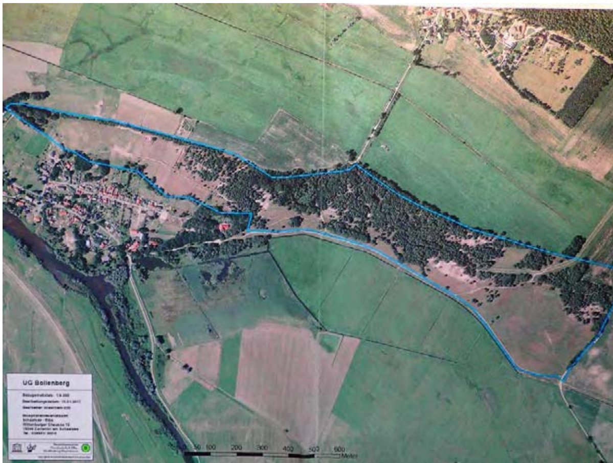
Abb. 1. Das NSG Bollenberg östlich des Ortes Gothmann.

liegt östlich des kleinen Ortes Gothmann bei Boizenburg/Elbe (Abb.1) Die Unterschutzstellung erfolgte nach der Wiedervereinigung 1990 mit dem Ziel eine der wenigen Binnendünen in Elbnähe zu erhalten.