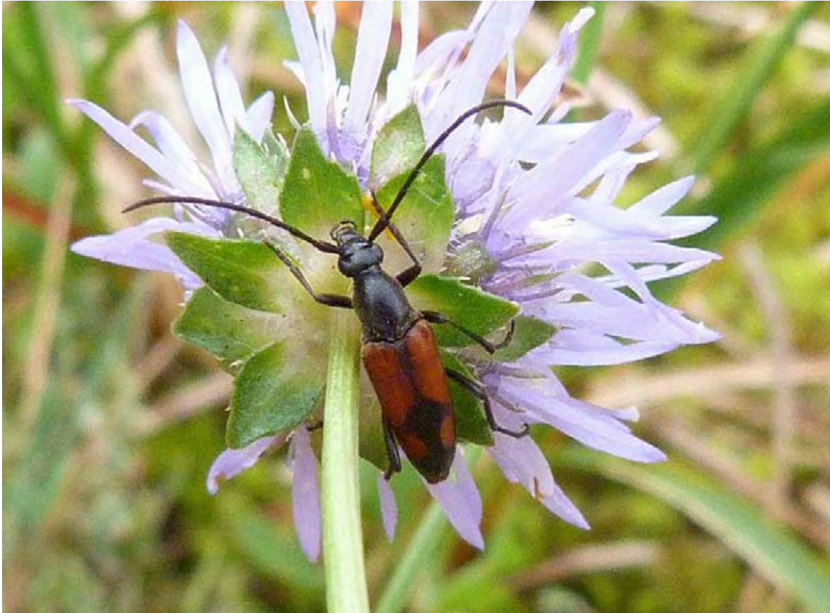
Abb.18 Stenurella bifasciata (Müll.) (10 mm).

Weiterhin besonders bemerkenswert ist das Vorkommen von drei seltenen xylobionten Käferarten, die hier am Bollenberg den bisher nordwestlichsten Punkt ihrer Verbreitung erreicht haben, es sind dies der Stäublingskäfer Symbiotes latus (Abb. 16), der Pflanzenkäfer Hymenalia rufipes (Abb. 17) und der Bockkäfer Stenurella bifasciata (Abb. 18).