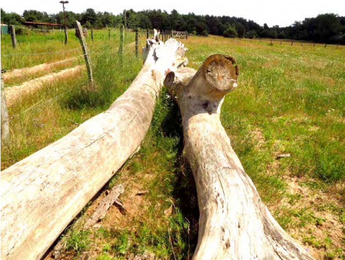
Abb. 10. Extensiv landwirtschaftlich genutzte Flächen im Randbereich der Binnendüne.