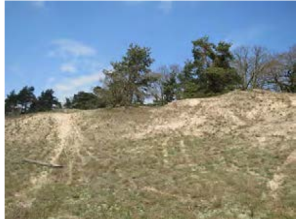
Abb. 2: Binnendüne Bollenberg.