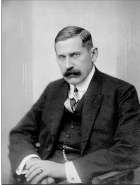
Abb. 1: Othenio ABEL, der Begründer der „Paläobiologie“. – Fig. 1: Othenio ABEL, founder of palaeobiology.

Im Juni 1911 verwendete der damals 36-jährige Othenio ABEL als tit. ord. Professor für Paläontologie an der Universität Wien erstmals den Begriff Paläobiologie in seinem Manuskript für das im Jahr 1912 erschienene Werk „Grundzüge der Paläobiologie der Wirbeltiere“ (Stuttgart, Schweizerbart'sche Verlagsbuchhandlung). Daher gilt das Jahr 1912 als Gründungsjahr der Paläobiologie. Das Buch ist Louis DOLLO, dem damaligen Konservator am Königlichen Naturhistorischen Museum in Brüssel (Belgien) gewidmet, der im Jahr 1910 den Begriff „Paléontologie éthologique“ für seine Arbeitsrichtung geprägt hatte. Ein Begriff, der sich jedoch international nicht durchsetzen sollte.