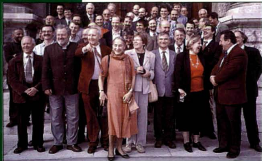
Die Tagungsteilnehmer des ÖEG-Fachgesprächs 2000 vor dem Naturhistorischen Museum in Wien