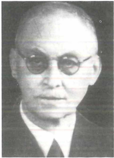
G. Bergt (Foto aus dem Landesarchiv Oranienbaum)

Weitere Quellen: Auskünfte und Unterlagen von der Witwe Ch. Benedix († 1996). [Dö]