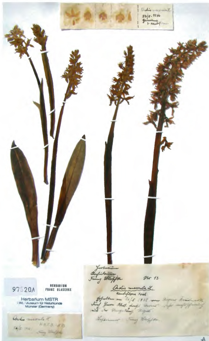
Abb. 4: Orchis maculata L. nach aktueller Terminologie Dactylorhiza maculata (L.) Soó, ein Beleg, der zur besseren Erkennung von Franz Blaschke mit einer Blütenübersicht versehen wurde.