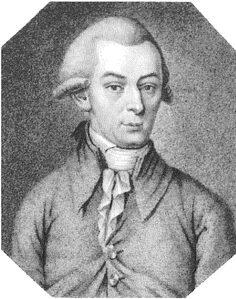
Alois Blumauer in einem zeitgenössischen Kupferstich von Wachsmann.

damaligen Jugend beinahe Kultstatus. Obwohl bereits 1798 verboten, 6 zählt die Aeneis-Travestie zu den vorbereitenden Schriften für die auf das Jahr 1848 hinzielenden revolutionären Bestrebungen gegen den Polizeistaat Metternichs.