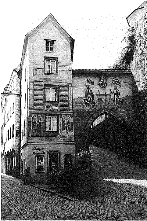
Blumauers Geburtshaus in Steyr.

zetti und Marlen Haushofer die Reihe jener Schriftstellerpersönlichkeiten an, denen ob ihrer biographischen Bezüge zur Region Pyhrn-Eisenwurzen Aufmerksamkeit gewidmet worden war. 26