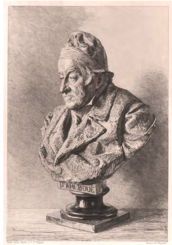
Fig. 1: Bust of Ami BOUÉ / Busto di Ami BOUÉ / Büste Ami BOUÉS

Sandra B. WEISS, Wien, sw@sandra-weiss.at