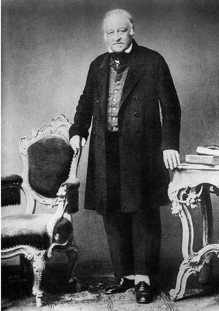
Ami Boué (1794–1881).