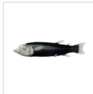
Gespensterfisch ( Winteria telescopa )