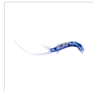
Teleskopfisch ( Gigantura chuni )