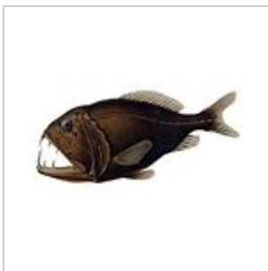
Fangzahnfisch ( Anoplogaster cornuta )

Brauer 1906. Die Zeichnungen stammen von Friedrich Winter