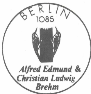
Abb. 9. Zentrales Postamt Berlin 1085, Sonderstempel zum Briefmarkenblock 1989. Zu Teil 3.4, Pos. 4

Sonderstempel zur 14. DDR-Emission, siehe (3), Einsatz 13. 6. bis 12. 8. 1989 43 ). In Stempelmitte zwei Baumläufer an einem Stamm 44 )