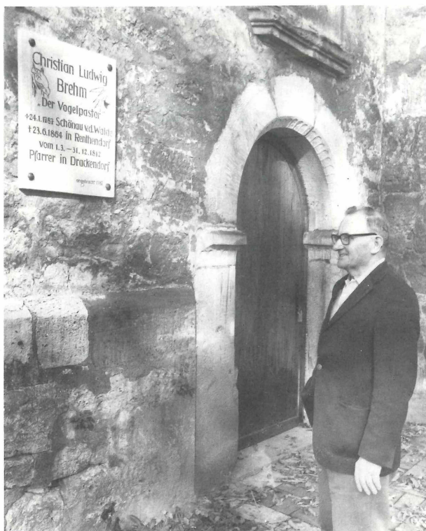
Abb. 1. Drackendorf, Kirche. Gedenktafel 1987 für C. L. BREHM und ihr geistiger Urheber KURT VOIGT. Zu Teil 1, Pos. 22