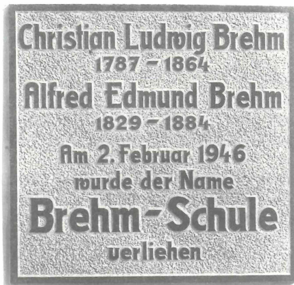
Abb. 4. Renthendorf, BREHM-Oberschule, Gedenktafel 1984. Zu Teil 1, Pos. 26

CHRISTIAN LUDWIG BREHM 1787 – 1864 ALFRED EDMUND BREHM 1829 – 1884 Am 2. Februar 1946 17) wurde der Name BREHM-Schule verliehen 18)