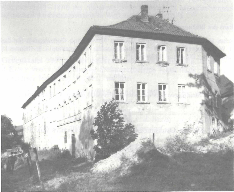
Abb. 3. Lausnitz, VON STEINSches Rittergut im Verfall 1986. Wirkungsstätte C. L. BREHMS 1809—1812. Zu Teil 1, Pos. 25