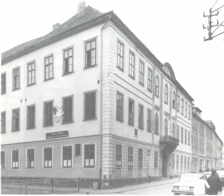
Abb. 2. Hildburghausen, Oberschule „JOSEPH MEYER“ 1987. Sitz des Bibliographischen Institutes 1828—1873. Zu Teil 1, Pos. 23