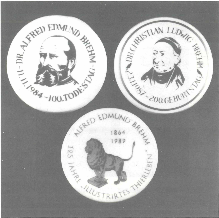
Abb. 12. Renthendorf, BREHM-Gedenkstätte. Porzellanplaketten 1984, 1987, 1989. Zu Teil 3.4, Pos. 6, 8, 9