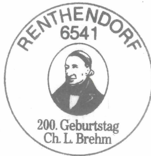
Abb. 11. Örtliche Poststelle 6541 Renthendorf, Sonderstempel zur C.-L.-BREHM-Ehrung 1987. Zu Teil 3.4, Pos. 7

Sonderstempel anlässlich des 200. Geburtstages von C. L. BREHM mit Porträt 46 ), Einsatzzeit 24. 1. bis 25. 4. 1987