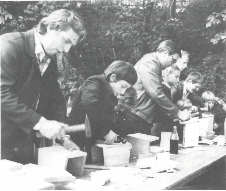
Abb. 6. Renthendorf, Pfarrhof. Nistkastenbau der Teilnehmer beim kirchlichen A.-E.-BREHM-Gedenken 1984. Zu Teil 3.1, Pos. 25