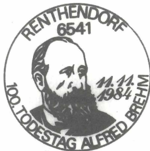
Abb. 10. Örtliche Poststelle 6541 Renthendorf, Sonderstempel zur A.-E.-BREHM-Ehrung 1984. Zu Teil 3.4, Pos. 5

Sonderstempel anlässlich des 100. Todestages von A. E. BREHM mit Porträt 45 ), Einsatz 11. 11. 1984, auch in einem Sonderpostamt bei der Tagungsstätte der Gedenkveranstaltung, siehe Teil 3.1, (26)