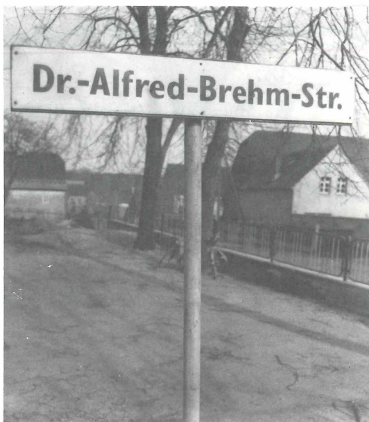
Abb. 13. Schmannewitz, Straßenschild. Zu Teil 3.5.