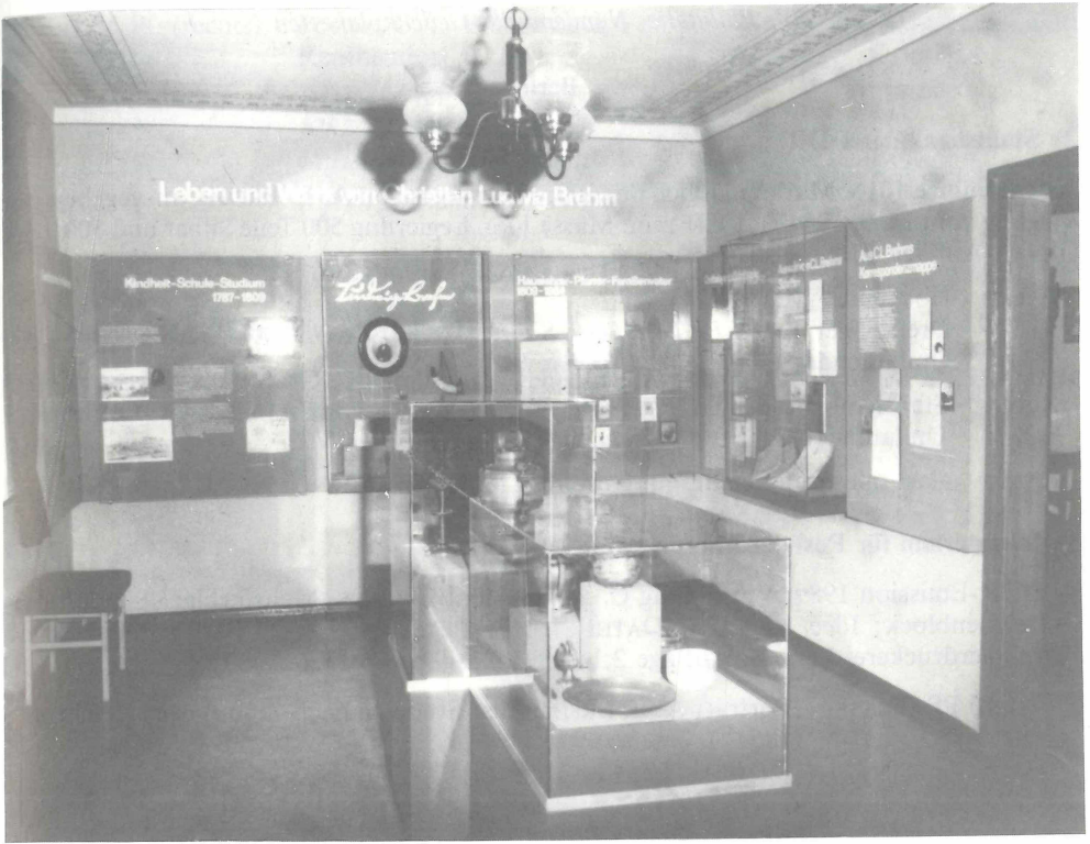
Abb. 7. Renthendorf, BREHM-Gedenkstätte. Ausstellungsraum zu C. L. BREHM, Neueinrichtung 1987. Zu Teil 3.2, Pos. 11