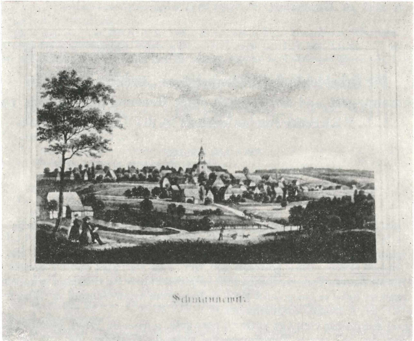
Abb. 1. Historische Ansicht von Schmannewitz, Kreis Oschatz. Nach einer Illustration von GOTTH. JAKISCH, Holzhausen