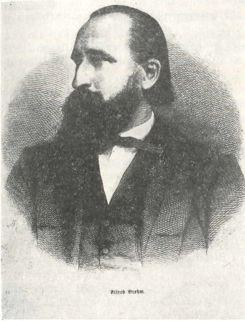
Abb. 4. Dr. A. E. BREHM (etwa 1869)