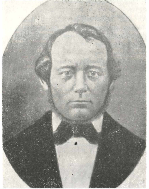
Abb. 5. CARL CHRISTIAN FISCHER (1818—1872)