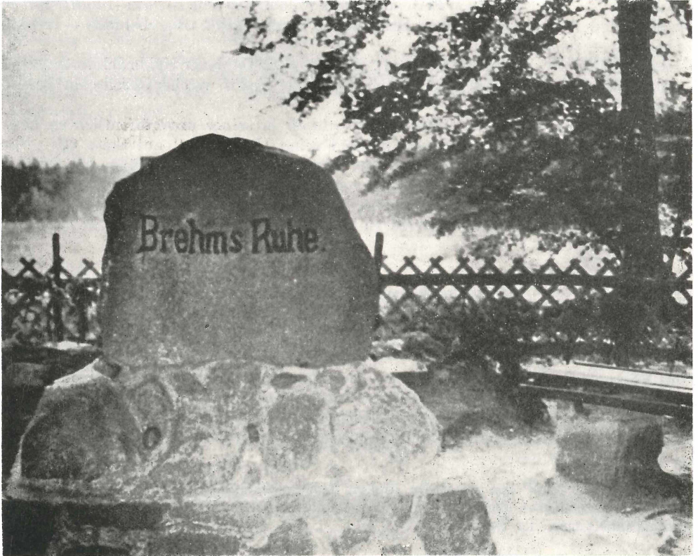
Abb. 2. Gedenkstein „Brehms Ruhe“, heutige Ansicht