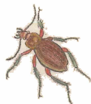
CAR. GRANULATUS FABR.

Habitat in arvis, pomatiis, sylvis, hybernans sub corticibus arborum.