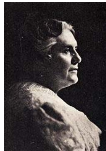
Anna Botsford Comstock

Im Alter von 20 Jahren nahm er an der Cornell University sein Studium auf. Da es keinen Studiengang Entomologie gab, wandte sich Comstock an den Leiter des Departments für Zoologie Burt G. Wilder (1841–1925), der nach Kräften versuchte, ihm weitere Bücher und Informationen zugänglich zu machen. Schließlich stellte ihn dieser als seinen Assistenten an. Ein Jahr später forderten 13 Mitstudenten die Universität auf, Comstock zu erlauben eine Entomologievorlesung für sie zu halten. Nach Wilders Plazet stimmte auch die Universität zu. Der Titel der Vorlesung im Frühlingsemester 1872 lautete Lectures and Field Work in Entomology . Bleibenden Eindruck machten dann die Besuche von Louis Agassiz und Charles Valentine Riley als Gastprofessoren an der Cornell University. Als Hermann August Hagen die Leitung der Insektensammlung des Museum of Comparative Zoology in Cambridge übernahm, zog es auch Comstock dorthin, um von Hagen zu lernen. Sein nächster Lehrer wurde Asa Fitch (1809–1879). Nun erhielt er seinen ersten offiziellen Lehrauftrag an der Cornell University und als in seinem zweiten Semester als Senior Wilder für eine Vorlesung an das Browdoin College gerufen wurde, vertrat ihn Comstock.