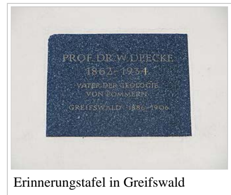
Erinnerungstafel in Greifswald