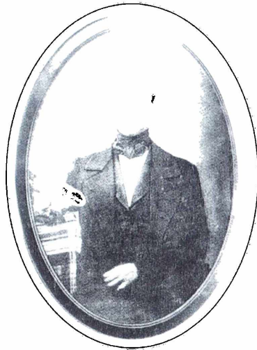
Abb.2: Christian Doppler Daguerrotypie, Prag 1844

Die für Christian Doppler wissenschaftlich fruchtbarste Zeit in Prag begann er als supplierender Professor für Mathematik und Physik am Technischen Institut, heute Technische Universität Prag, 1838. 1841 wurde er zum Ordentlichen Professor für Mathematik und Physik berufen und Mitglied der Böhmisches Akademie der Wissenschaften. Am 25. Mai 1842 stellte er sein Hauptwerk "Über das farbige Licht der Doppelsterne" - in dem er den Dopplereffekt beschreibt - vor.