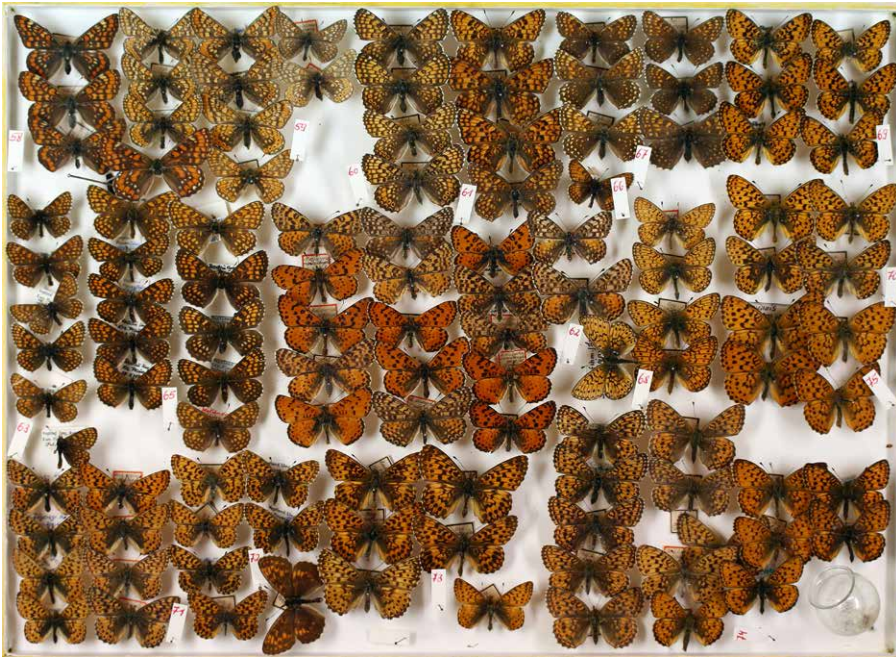
Abb. 2 Kasten mit Nymphalidae der Sammlung Klaus Ebert, Foto: S. Erlacher.