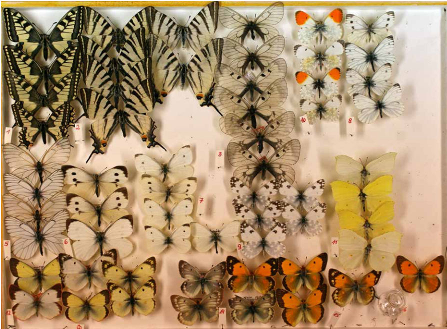
Abb 1 Kasten mit Papilionidae und Pieridae der Sammlung Klaus Ebert, Foto: S. Erlacher.