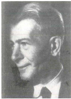
F. Engel (aus Scholz 1964)

Biogr. Lit.: Kasten (1971, Portr.). [Ru]