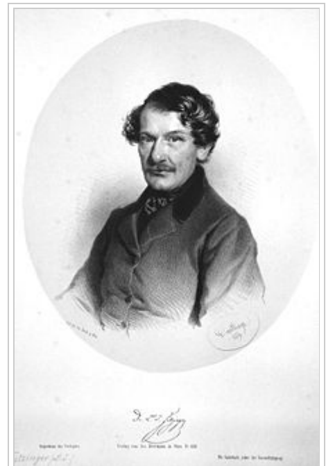
Leopold Josef Fitzinger, Lithographie von Adolf Dauthage, 1859

Fitzinger entwickelte ein breites Themenspektrum in der Zoologie.