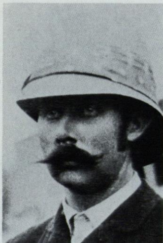
Erzherzog FRANZ FERDINAND VON ÖSTERREICH 1863–1914

Polnischer Arzt und Zoologe, der 1863 wegen Teilnahme am Warschauer Januaraufstand verhaftet und auf 12 Jahre nach Sibirien verbannt wurde. Wurde zum Entdecker der berühmten „Meeresfauna“ des Baikalsees und setzte seine zoologischen Forschungen nach der Abbüßung der Strafe als Regierungsarzt auf Kamtschatka fort. Die Säugetiersammlung des Museums verdankt ihm die größte existierende Serie von Schädeln des riesigen Kamtschatka-Bären und als besonderen Schatz eines der vollständigsten Skelette der seit der Mitte des 18. Jahrhunderts ausgestorbenen Stellerschen Seekuh.