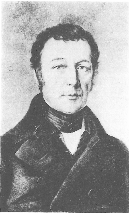
Fig. 3. E. F. GERMAR.

P. F. M. A. DEJEAN (1780—1845) (Fig. 4) war der größte Coleopterologe seiner Zeit. Er war der Sohn eines Generals und wurde somit auch auf die militärische Laufbahn vorbereitet, die durch die Geschehnisse im Kaiserreich bestimmt wurde. Er erlangte den Rang