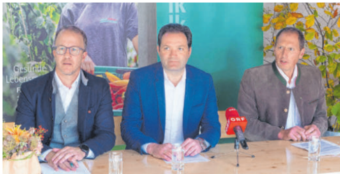
Der Landesrat, der Landwirtschaftsminister und der Präsident der Landwirtschaftskammer bei der Pressekonferenz.