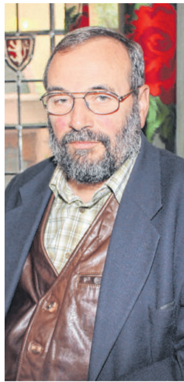
Georg Grabherr: Er liebte Natur, Blumen und Menschen. VN

Grabherr wurde für sein Wirken hoch ausgezeichnet. Er erhielt 2011 den Österreichischen Naturschutzpreis. 2013 wurde er vom Klub der Bildungs- und Wissenschaftsjournalisten Österreichs als erster Botaniker zum Wissenschaftler des Jahres 2012 ernannt. 2013 erhielt er auch den Vorarlberger Wissenschaftspreis sowie das Österreichische