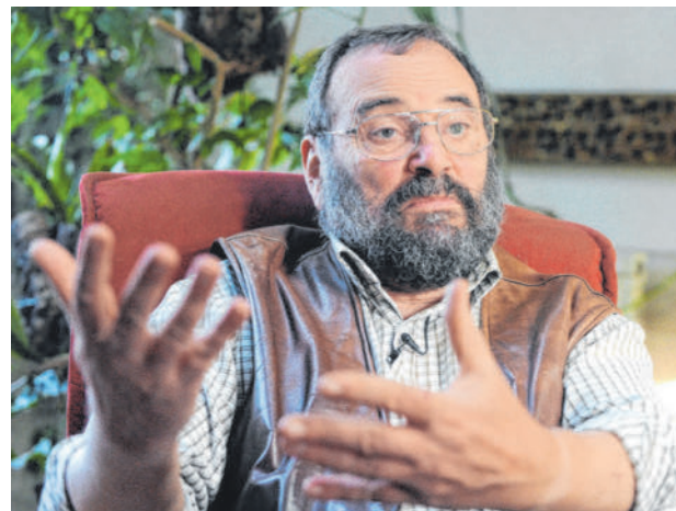
Georg Grabherr im Jänner 2013, kurz nachdem er zum Wissenschaftler des Jahres 2012 gewählt wurde.

Bei seinen naturschützerischen Bemühungen kamen Grabherr Funktionen wie der Vorsitz im Vorarlberger Naturschutzrat oder im österreichischen Nationalkomitee des Unesco-Programms „Man and Biosphere“ zugute. Stolz war er auch auf seine Naturexkursionen mit der Vorarlberger Landesregierung. Dabei wählte er mit Bedacht „nicht Problemfälle, sondern Gutfälle – denn wir müssen positiv polen“. Der Ökologe war überzeugt, dass ein solcher Besuch im Wald oder im Moor „allen Regierungen gut täte“.