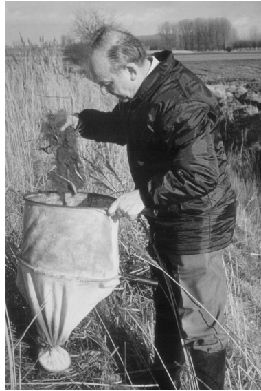
Wintergesiebe im Februar 1976 in Nideggen-Ginnik